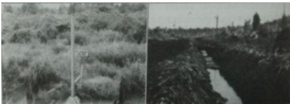
Gambar 1. Lahan gambut sebelum (kiri) dan setelah (kanan) direklamasi

Penyusutan volume yang irreversible menyebabkan hilangnya daya mengikat air serta meningkatkan sensitivitas terhadap erosi.