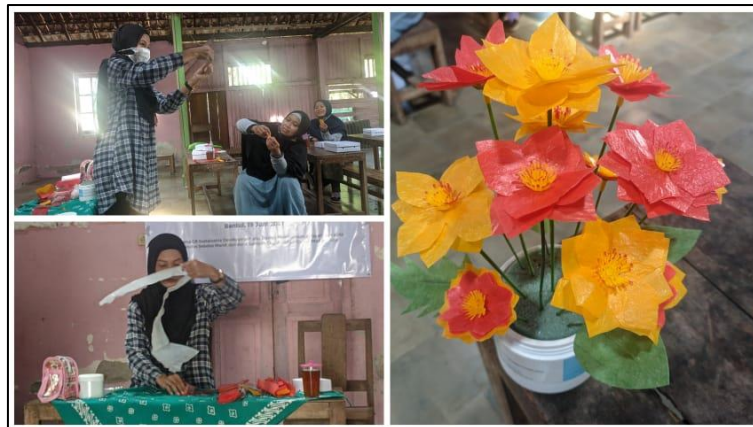
Gambar 3. Pelatihan pengolahan sampah plastik daur ulang

Selanjutnya, Sesi kedua kegiatan pelatihan diisi dengan praktik pembuatan bunga dari daur ulang sampah plastik. Sesi ini berkaitan dengan upaya merubah dan memberikan nilai tambah pada sampah agar menjadi produk yang lebih bermanfaat dan bernilai ekonomi lebih tinggi. Kerajinan bunga dari plastik cocok untuk dikembangkan karena secara teknis tidak terlalu rumit dan membutuhkan olahan bahan plastik yang susah. Bahan utama plastik berasal dari plastik kresek. Plastik kresek yang sudah dibersihkan selanjutnya dipotong persegi panjang dan kemudian disetlika. Proses setrika dilakukan dengan bantuan kain jadi tidak secara langsung panas menyentuh bahan plastik. Kresek yang digunakan juga beberapa tipe ketebalan.