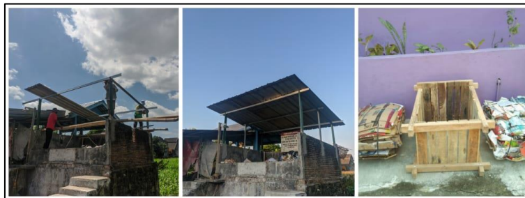
Gambar 4. Foto Bantuan hibah sarana penunjang bank sampah Galvalum sebagai penutup rumah sampah (kiri) dan alat Press Sampah (kanan)

perbaikan rumah sampah dengan pemberian galvalum sebagai penutup bak sampah di rumah sampah. Bak sampah di rumah sampah merupakan bak besar untuk pembuangan sampah sementara (TPS) di dusun madugondo. Sebelumnya bak sampah masih dalam kondisi terbuka sehingga membutuhkan penutup untuk menjaga sampah dari hujan yang membuat timbulan sampah menjadi basah dan semakin berbau. Bantuan hibah kedua berupa alat press sampah. Alat ini juga merupakan usulan dari pengelola. Alat press sampah digunakan dalam proses pemilahan sampah. Setelah sampah dipilah-pilah selanjutnya sampah dikumpulkan dengan cara di tekan menggunakan alat press tersebut. Selama ini, proses press dilakukan dengan manual sehingga membutuhkan tenaga yang lebih besar.