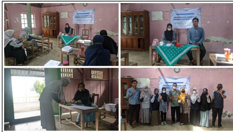
Gambar 2. Pelatihan manajemen pengelolaan bank sampah

Sesi pertama diisi dengan materi manajemen pengelolaan bank sampah dilakukan dengan diskusi dan berbagi pengalaman pengelolaan sampah. Materi yang didiskusikan yaitu teknis pengumpulan sampah, teknis pemilahan sampah, pendataan dan pembukuan, sistem tabungan, pembagian keuntungan, hingga jaringan pengepul sampah.