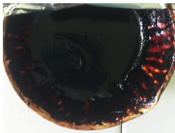
Gambar 1. Ekstrak Kental Umbi Bawang Dayak

Jumlah total ekstrak kental yang diperoleh adalah 33,5484 g dan rendemen yang didapatkan adalah 6,65% (Gambar 1).