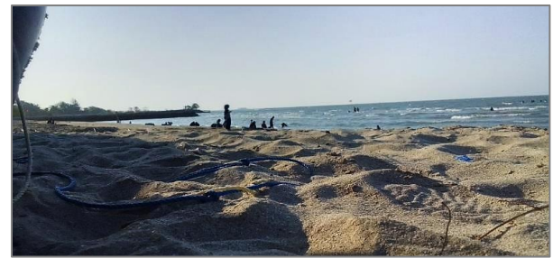
Gambar 1. Pantai Pasir Putih Dalegan Gresik

terlaksana hanya separuh dari prosentase yang ditetapkan (Disbudpar Gresik, 2020).