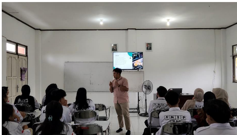
Gambar 1. Dosen dan Mahasiswa Memaparkan Materi Sosialisasi Tentang Literasi Keuangan