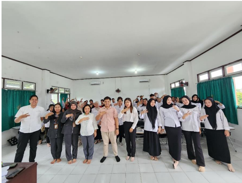
Gambar II. Foto Bersama Antara Dosen, Mahasiswa, Pegawai Galeri 24 Palangka Raya dan Partisipan