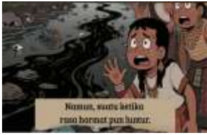
gambar 7. Bencana alam