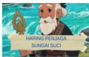
gambar 2. Judul