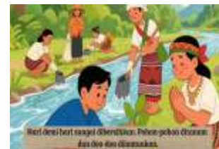
gambar 12. Pertobatan