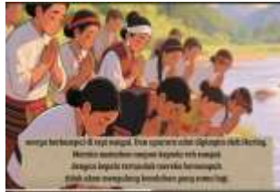
gambar 11. Ritual