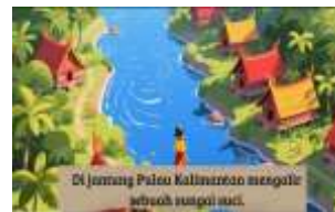
gambar 3. Pengenalan