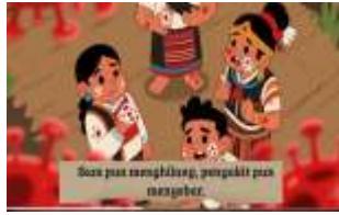
gambar 8. Bencana alam