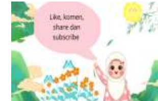
gambar 15. Penutup