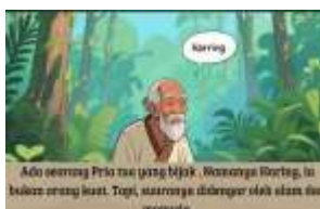
gambar 5. Tokoh utama