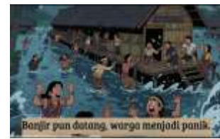
gambar 9. Bencana alam