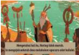
gambar 10. Ritual