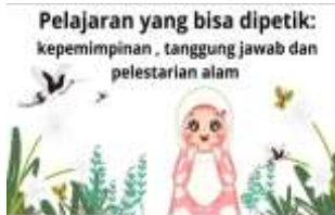
gambar 14. Pesan moral