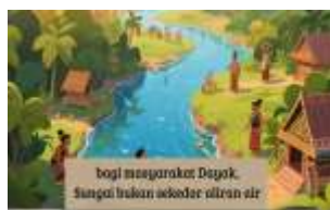
gambar 4. Kearifan lokal