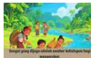
gambar 6. Kearifan lokal