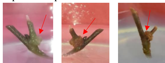
Gambar 2. Perubahan warna kalus dari putih hingga coklat pada buku durian lahung (tanda panah)

Kalus pada penelitian ini berdasarkan hasil pengamatan secara visual dari awal mula muncul hingga pengamatan minggu kedelapan setelah tanam mengalami perubahan warna. Pada awal pertumbuhannya (1 MST), kalus yang muncul berwarna putih. Memasuki minggu kelima setelah tanam, kalus mulai berwarna coklat muda dan menjadi coklat saat berumur 8 MST. Perubahan warna kalus pada eksplan buku durian lahung dapat dilihat pada Gambar 2.