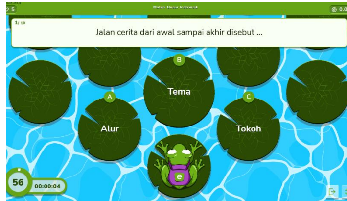
Gambar I. Gambar Permainan Media Educaplay

Pada siklus I peneliti mulai menerapkan media Educaplay pada mata pelajaran Bahasa Indonesia materi unsur intrinsik untuk kelas III di SDN Pakis V-372 Surabaya. Respon siswa kelas III ketika proses pembelajaran menggunakan media Educaplay semakin aktif dalam kegiatan pembelajaran. Di akhir pembelajaran peneliti memberikan posttest , setelah diberikan posttest hasilnya mengalami peningkatan yang cukup signifikan. Dari 27 siswa, terdapat 19 siswa yang telah mencapai Kriteria Ketuntasan Tujuan Pembelajaran (KKTP), sementara 8 siswa belum mencapai kriteria Ketuntasan Tujuan Pembelajaran (KKTP). Pada tahap siklus I siswa yang mencapai ketuntasan sebesar 79,47% dan nilai rata-rata 72,2. Dengan pencapaian ini, penelitian pada siklus I belum dikatakan berhasil karena belum melebihi indikator yang ditetapkan, yaitu 80%. Sehingga, penelitian ini dilanjutkan ke siklus II untuk menguji keberhasilan media Educaplay serta mencapai ketuntasan hasil belajar yang signifikan.