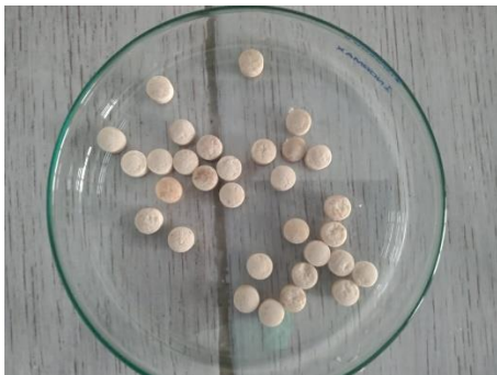
Gambar 2. Tablet Effervescent

reaksi effervescent antara zat asam dan zat basa yang menghasilkan gas karbondioksida untuk proses pelarutan tablet effervescent (Syahrina D & Noval, 2021). Berdasarkan penelitian hasil uji waktu larut tablet menunjukkan pada F1 yaitu 01.99 menit, F2 yaitu 02.25 menit, F3 yaitu 02.70 dan F4 yaitu 04.03 menit. Hasil pada semua formula sudah memenuhi persyaratan waktu larut tablet yang baik yaitu kurang dari 5 menit. Namun formula yang memiliki waktu larut tercepat yaitu F1 dengan waktu 01.99 menit, semakin cepat kelarutan tablet effervescent maka akan semakin baik (Syahrina D & Noval, 2021). Waktu larut tablet effervescent disebabkan oleh faktor reaksi effervescent yang terlalu dini saat proses pencetakan, sehingga menyebabkan daya atau reaksi effervesting menjadi berkurang. Selain itu, kelembaban udara saat proses pencetakan juga berpengaruh karena akan meningkatkan penurunan kualitas tablet terutama pada daya larut dari tablet effervescent (Noorjannah & Noval, 2020) (Noval & Rosyifa, 2021).