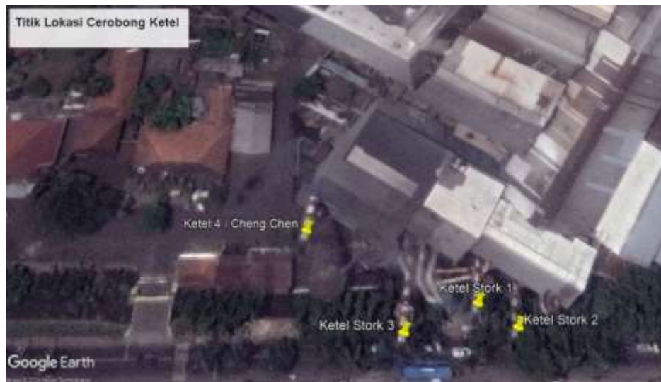
Gambar 1. Peta Lokasi Penelitian