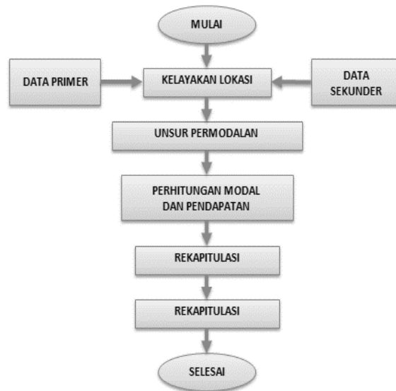
Gambar 1. Bagan Alir Penelitian