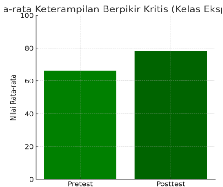
Gambar II. Grafik Keterampilan Berpikir Kritis Kelas Eksperimen