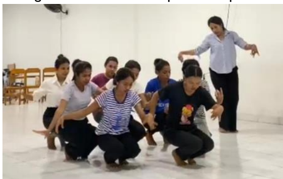
Gambar II. Penjelasan mendalam mengenai makna ritual dan sosial gerakan Tari Caci kepada mahasiswa.

Pergeseran ini terjadi melalui apa yang peneliti identifikasi sebagai proses defamiliarisasi produktif konsep yang dipinjam dari formalisme Rusia (Lephen, 2025). Ketika seniman tamu menjelaskan bahwa setiap gerakan dalam Tari Caci mengandung makna ritual dan sosial yang spesifik, seni tari tiba-tiba menjadi 'asing' dalam arti yang positif: ia terlihat baru, kompleks, dan penuh lapisan makna yang sebelumnya tidak terlihat. Mahasiswa M5 (22 tahun, asal Manggarai) yang awalnya bersikap paling skeptis mengungkapkan dalam wawancara akhir: "Dulu saya pikir Caci itu pameran kekerasan saja. Sekarang saya lihat itu adalah cara masyarakat saya menyelesaikan konflik dengan estetika. Itu sofistikasi tinggi sekali." proses transfer pengetahuan dan pemaknaan gerak tradisional ini dapat dilihat pada Gambar II.