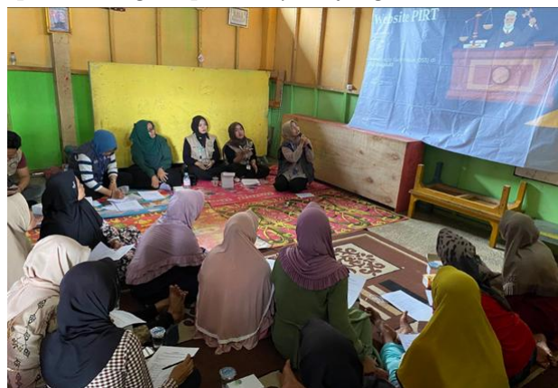
Gambar 1. Proses Pelatihan CPPB-IRT.