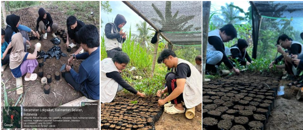
Gambar 5. Pembibitan kopi Liberika di shade house yang sudah selesai.

Terakhir melakukan pembibitan kopi Liberika Lokpaikat sebanyak 5.000 buah yang disajikan pada Gambar 5. Tahapannya dimulai dengan mengisi polybag dengan media tanam yang berisi campuran tanah, arang sekam, sekam padi, dan kotoran ayam petelur yang dicampur dan diaduk menjadi satu menggunakan cangkul lalu dimasukkan ke dalam polybag hingga penuh, sedangkan untuk bibitnya menggunakan bibit yang berasal dari bibit dari biji yang tumbuh liar, sudah memiliki daun sejati yang tumbuh di sekitar indukan tanaman kopi Liberika yang telah ditanam sejak lama. Bibit dari biji yang tumbuh liar yang sudah di cabut kemudian di pangkas akarnya dan langsung ditanam pada media tanam yang sudah diisi di polybag .