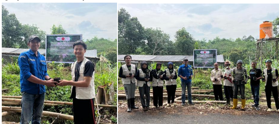
Gambar 6. Peresmian shade house oleh Kepala Desa Puncak Harapan.

Setelah proses pembibitan selesai, dilakukan peresmian secara simbolis oleh Kepala Desa Puncak Harapan dan dihadiri oleh perwakilan RT/RW, warga desa dan mahasiswa/i KKN yang disajikan pada Gambar 6. Kegiatan ini dilaksanakan di hari minggu 31 Agustus 2025, pada waktu pukul 10.00 WITA dengan dilakukannya sesi foto bersama dan pembagian bibit kepada warga Desa Puncak Harapan yang berminat untuk membudidayakan kopi di sela tanaman karet. Diharapkan dengan adanya shade house ini dapat membantu pengembangan budidaya kopi di sela tanaman karet di Desa Puncak Harapan berupa penyediaan untuk bibitnya.