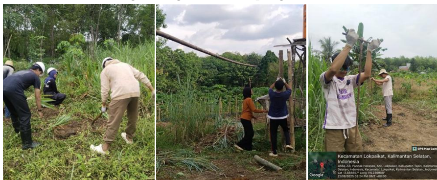
Gambar 4. Pembersihan lahan dan pembuatan shade house .

Selanjutnya membersihkan lahan dari tanaman-tanaman yang tidak diperlukan dan memastikan agar tidak mengganggu proses pembangunan shade house yang akan dilakukan pada lahan tersebut (Gambar 4), kemudian dilanjutkan dengan memulai pembangunan shade house seperti pembuatan lubang tiang menggunakan bor tiang untuk menancapkan 18 tiang bambu agar tidak mudah roboh, lalu diteruskan dengan memasang 2 buah bambu yang disambung untuk dipergunakan sebagai pondasi pada tiap baris tiang yang terdiri dari 3 baris dan baris ke 2 digunakan tiang yang lebih tinggi dari pada tiang pada baris ke 1 dan ke 3. Lalu pemasangan paranet dengan ukuran 3 x 60 m 2 , dilakukan setelah seluruh struktur bangunan selesai dipasang dan dipotong sebanyak 6 buah lalu tiap sambungan dari paranet dijahit menggunakan tali bangunan, untuk memastikan tidak terbang dan tergeser saat tertiuip angin.