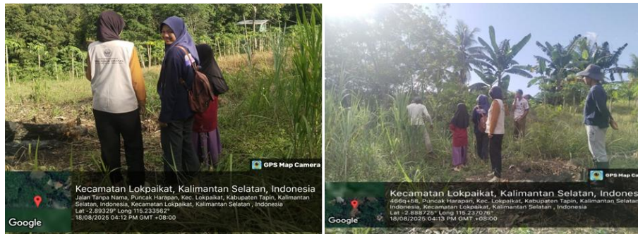
Gambar 2. Survei lokasi untuk pembuatan shade house .

Proses pembuatan shade house dilanjutkan dengan melakukan pengadaan bahan-bahan untuk membangun shade house (Gambar 3) berupa bambu yang berukuran cukup besar untuk digunakan sebagai kerangka dari pembangunan shade house , dengan jumlah sebanyak 18 buah bambu sepanjang 1,5 m yang digunakan sebagai tiang dan diberi lubang untuk memasukkan pondasi nantinya, dan 6 buah bambu sepanjang 2 m yang digunakan sebagai pondasi yang mana 2 buah bambu saling disambungkan agar panjangnya cukup untuk pondasi pada satu baris tiang dan membeli paranet dengan ukuran 3 x 60 m 2 , serta bahan-bahan pendukung lainnya seperti paku, tali tukang, dan polybag .