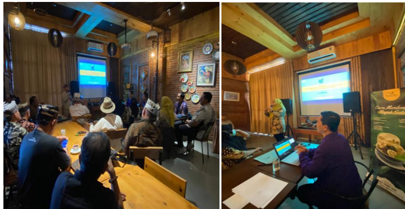
Gambar 2. Pemaparan dari Ketua Dewan Kesenian Blambangan dan Dokter Jantung.