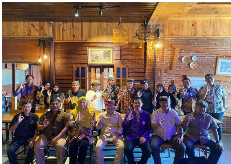
Gambar 3. Foto Bersama Anggota Dewan Kesenian Blambangan.