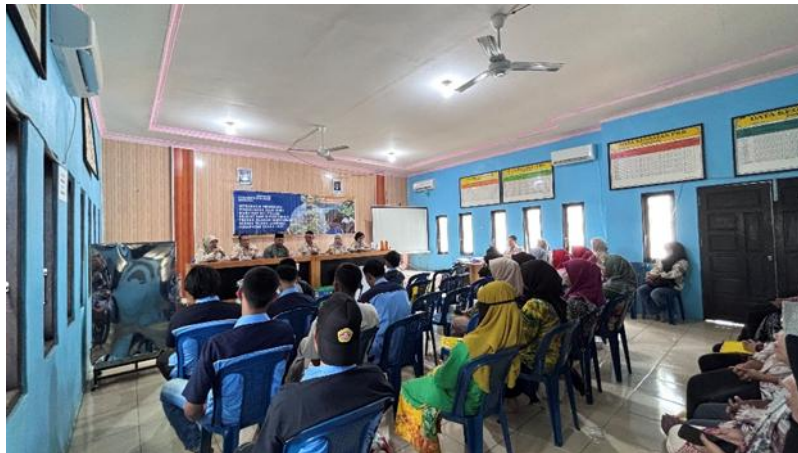
Gambar 1. Kegiatan sosialisasi dan diskusi dengan peserta kegiatan.

proses penyuluhan juga dibuka langsung sesi diskusi tentang produk olahan kelor. Sebelum dilakukan kegiatan ini tanaman kelor yang ada di sekitar masyarakat hanya digunakan dan diolah sebagai bahan olahan mie dan stik kelor. Gambar kegiatan sosialisasi pengolahan produk daun kelor dapat dilihat pada Gambar 1.