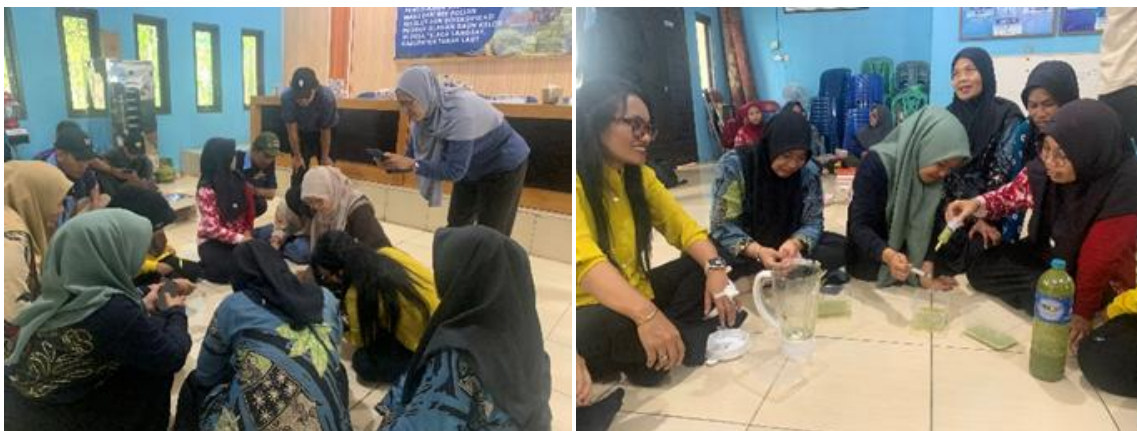
Gambar 2. Kegiatan praktik pembuatan olahan kelor dengan peserta kegiatan.

Tahap praktik merupakan inti dari kegiatan pelatihan, di mana peserta terlibat langsung dalam pembuatan dan pengemasan produk olahan daun kelor. Dalam sesi ini, peserta dibimbing untuk mengolah daun kelor menjadi berbagai produk, seperti stik daun kelor, puding kelor, dan serbuk daun kelor sebagai bahan tambahan makanan. Melalui praktik ini, mitra belajar teknik penggorengan yang lebih efisien dengan penggunaan alat peniris sederhana untuk mengurangi kadar minyak pada produk stik, sehingga dapat memperpanjang masa simpannya. Kegiatan praktik dapat terlihat pada Gambar 2.