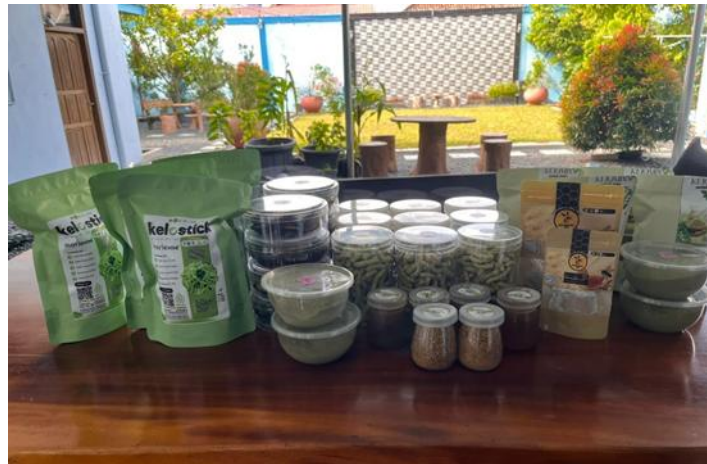
Gambar 3. Inovasi desain produk olahan daun kelor.