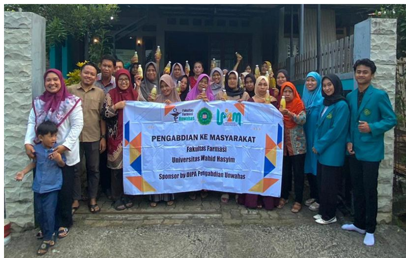
Gambar 5. Foto bersama para peserta.

Hasil paparan materi dan pelatihan pembuatan eco enzyme diukur tingkat keberhasilannya menggunakan postes. Tahapan kegiatan postes dilaksanakan sebagai bentuk evaluasi akhir untuk menilai tingkat pemahaman dan penerapan materi yang telah disampaikan selama program berlangsung. Tujuan postes adalah untuk mengukur keberhasilan proses pembelajaran serta efektivitas pengabdian dalam meningkatkan kapasitas peserta, sehingga dapat memastikan bahwa tujuan program telah tercapai secara optimal. Berdasarkan hasil evaluasi, nilai rata-rata postes sebesar 81,4 menunjukkan bahwa peserta secara umum memiliki penguasaan materi yang baik dan mampu mengimplementasikan pengetahuan yang diperoleh dalam praktik. Meskipun demikian, hasil ini juga mengindikasikan adanya peluang untuk melakukan perbaikan dan pendalaman materi melalui tindak lanjut penguatan atau pelatihan tambahan guna meningkatkan kualitas hasil pengabdian masyarakat secara berkelanjutan. Kegiatan pengabdian masyarakat ditutup dengan foto bersama para peserta pelatihan (Gambar 5).