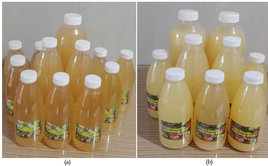
(a) (b) Gambar 4. Produk eco enzyme (a) kulit nanas, (b) kulit jeruk.

Hasil paparan materi dan pelatihan pembuatan eco enzyme diukur tingkat keberhasilannya menggunakan postes. Tahapan kegiatan postes dilaksanakan sebagai bentuk evaluasi akhir untuk menilai tingkat pemahaman dan penerapan materi yang telah disampaikan selama program berlangsung. Tujuan postes adalah untuk mengukur keberhasilan proses pembelajaran serta efektivitas pengabdian dalam meningkatkan kapasitas peserta, sehingga dapat memastikan bahwa tujuan program telah tercapai secara optimal. Berdasarkan hasil evaluasi, nilai rata-rata postes sebesar 81,4 menunjukkan bahwa peserta secara umum memiliki penguasaan materi yang baik dan mampu mengimplementasikan pengetahuan yang diperoleh dalam praktik. Meskipun demikian, hasil ini juga mengindikasikan adanya peluang untuk melakukan perbaikan dan pendalaman materi melalui tindak lanjut penguatan atau pelatihan tambahan guna meningkatkan kualitas hasil pengabdian masyarakat secara berkelanjutan. Kegiatan pengabdian masyarakat ditutup dengan foto bersama para peserta pelatihan (Gambar 5).