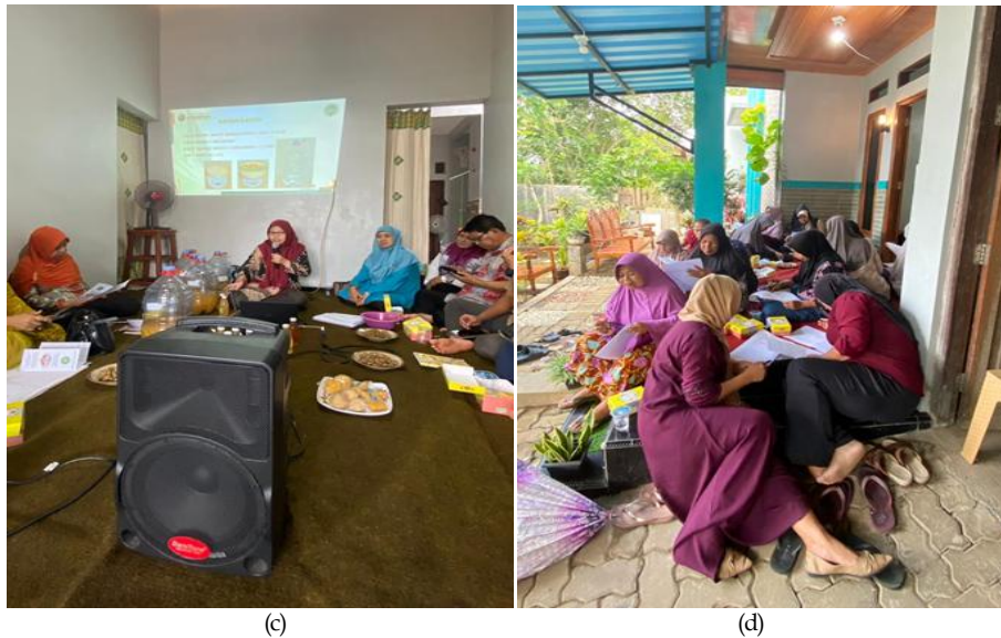
Gambar 3. Foto-foto kegiatan (a) para peserta mengisi daftar hadir, (b) pretest , (c) paparan materi, (d) posttest .