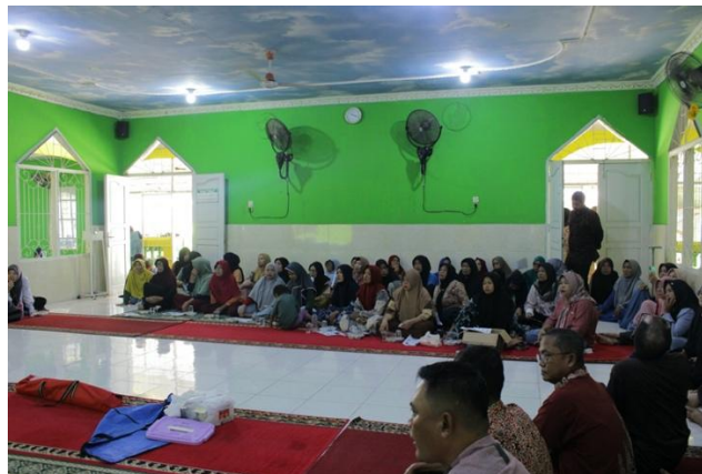
Gambar 2. Peserta Kegiatan Pengabdian yang terdiri dari Perangkat Kelurahan, Tokoh Masyarakat, Kader PKK, serta Perwakilan Orang Tua dan Pemuda.

Sebanyak 30 orang berpartisipasi dalam kegiatan, termasuk perangkat kelurahan, tokoh masyarakat, anggota PKK, dan perwakilan orang tua dan pemuda. Jumlah peserta yang beragam ini menunjukkan bahwa masalah judi online sudah menjadi masalah sosial lintas generasi dan tidak terbatas pada kelompok usia tertentu. Banyak peserta mengatakan mereka tertarik mengikuti acara ini karena mereka atau anggota keluarga mereka pernah bermain judi online, baik secara langsung maupun tidak langsung. Ini menunjukkan bahwa masalah judi online telah masuk ke dalam rumah masyarakat, dan pendekatan edukatif yang tepat diperlukan untuk menanganinya.