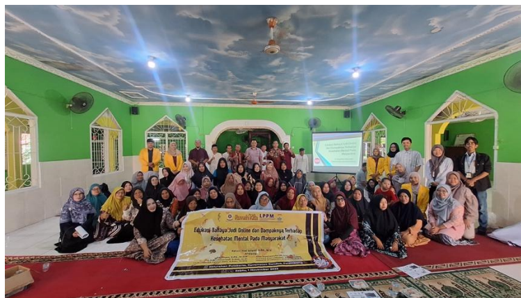
Gambar 4. Foto bersama Tim Pengabdian dari Jurusan Sosiologi FISIP Universitas Sriwijaya dengan Peserta Pengabdian.

Kegiatan ini juga dilengkapi dengan sesi refleksi kelompok di mana peserta diajak untuk menentukan penyebab utama maraknya judi online di daerah mereka. Hasil refleksi menunjukkan bahwa literasi digital yang rendah, ketidakstabilan ekonomi rumah tangga, dan kurangnya kontrol sosial terhadap lingkungan adalah penyebab utama. Beberapa peserta menyatakan bahwa mereka sering menerima pesan berantai atau iklan judi di aplikasi perpesanan seperti WhatsApp dan Facebook, tetapi tidak tahu cara memblokir atau melaporkannya. Ke depannya, ini akan menjadi kontribusi penting bagi tim pengabdian untuk memperluas program literasi digital menjadi lebih berguna.