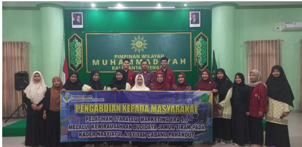
Gambar 3. Foto Bersama Tim Pengabdian dan Kader Nasyiatul Aisyiyah.

UMKM (Rozikin et al. 2024). Desain pelatihan intensif ini memungkinkan transfer ilmu yang komprehensif, di mana materi difokuskan pada aspek-aspek paling praktis dan berdampak langsung pada ide bisnis (Heni et al. 2024). Marketing 5.0 menjadi bekal bagi kader dalam menerapkan teknologi digital untuk menjangkau segmen pasar yang lebih luas dan melaksanakan transaksi secara efisien, sementara prinsip ekonomi syariah menanamkan kerangka etika yang esensial, seperti penentuan harga yang adil dan penghindaran gharar . Model integratif ini memastikan bahwa ide usaha yang terbentuk bersifat holistik : siap secara teknis, berorientasi digital dan memiliki kepatuhan syariah (Santoso et al. 2025). Dengan demikian, kegiatan ini tidak hanya memberikan edukasi, tetapi juga menawarkan cetak biru bisnis yang berkelanjutan dan etis bagi kader Nasyiatul Aisyiyah Cabang Pahandut, sebuah kontribusi signifikansi terhadap pengembangan kewirausahaan berbasis komunitas (Kahfi et al. 2024).