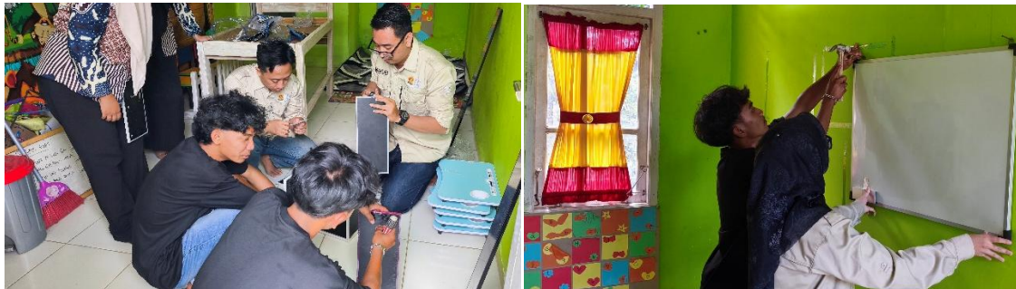
Gambar 5. Bantuan Berbentuk Fisik.

yakni Produk Hard (berbentuk fisik) dan Produk Soft (Non-Fisik). Produk-produk tersebut dirancang sebagai wujud konkret dari upaya peningkatan literasi, pemberdayaan masyarakat, serta penguatan kapasitas lingkungan belajar yang inklusif. Selain itu, uraian ini juga menampilkan bagaimana setiap produk berperan dalam menciptakan nilai tambah, meningkatkan efektivitas program, serta memperluas dampak kebermanfaatannya Sudut Pintar dalam konteks pembangunan sosial dan pendidikan.