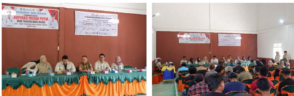
Gambar 3. Pelaksanaan Kegiatan Sosialisasi.

Secara keseluruhan, kegiatan sosialisasi menghasilkan pemahaman bersama bahwa Program SUDUT PINTAR merupakan kebutuhan prioritas desa, bukan sekadar inisiatif akademik. Dukungan perangkat desa yang menyediakan ruang publik, keterlibatan komunitas pemuda sebagai relawan pengelola awal, serta kesediaan masyarakat untuk berpartisipasi dalam kegiatan literasi menunjukkan bahwa tahap sosialisasi telah berhasil membangun legitimasi sosial dan memastikan keberlanjutan program di tahap implementasi berikutnya. Dengan demikian, sosialisasi dapat dipandang sebagai komponen strategis yang menjembatani tujuan akademik dengan kebutuhan nyata masyarakat dan memastikan