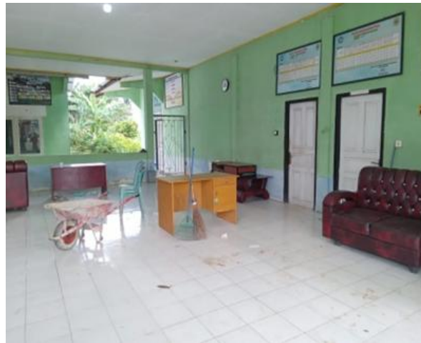
Gambar 1. Kantor Desa Tanjung Baru Ranau, OKU Selatan.