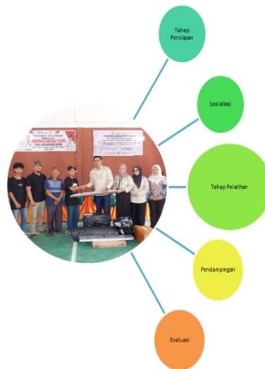
Gambar 2. Metode Pengabdian Masyarakat.

menciptakan kesan belajar yang menyenangkan bagi anak-anak. Metode pelaksanaan kegiatan pengabdian masyarakat ini menggunakan pendekatan edukatif dan pendampingan secara langsung yang melibatkan masyarakat sekitar, dapat dilihat pada gambar dibawah ini.