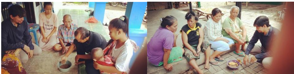
Gambar 3. Pelaksanaan Penyuluhan Maggot ke Masyarakat. (Dokumentasi Lapang, 2025)

Peserta FGD membahas kesiapan fasilitas, pembagian peran warga, serta strategi agar kegiatan pengelolaan sampah menggunakan maggot dapat berjalan secara berkelanjutan. Pertemuan tersebut juga dimanfaatkan untuk menilai hambatan yang mungkin muncul, seperti keterbatasan ruang, kekhawatiran terkait bau, atau minimnya pengetahuan awal tentang budidaya maggot. Diskusi FGD dari dua pertemuan ini berperan penting dalam membangun pemahaman bersama antara tim pengabdian dan warga. Pemaparan materi melalui demonstrasi visual membuat warga merasa lebih yakin bahwa teknologi pengolahan sampah organik menggunakan maggot BSF dapat diterapkan secara mudah dan tidak membutuhkan peralatan rumit. Pertukaran pendapat dalam sesi diskusi membantu warga mengidentifikasi solusi yang sesuai dengan kondisi lingkungan mereka. Hasil FGD menunjukkan bahwa sebagian besar Warga menyambut baik inovasi ini, terutama karena potensi manfaat lingkungannya serta peluang ekonomi yang dapat dibangun dari pemanfaatan maggot dan kasgot.