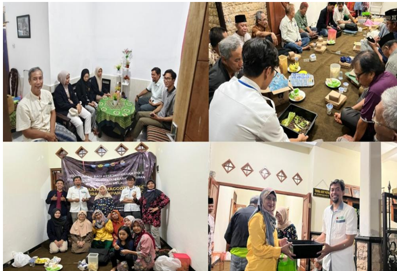
Gambar 2. Pelaksanaan Focuss Group Discussion (FGD).

Kegiatan FGD yang terlihat pada Gambar 2 menunjukkan suasana diskusi yang berlangsung secara interaktif di tengah warga. Tim pengabdian membawa contoh media biokonversi berupa wadah berisi sampah organik dan maggot BSF, kemudian menjelaskannya kepada warga yang duduk melingkar. Penyampaian materi dilakukan dengan metode demonstrasi langsung agar warga dapat memahami proses biokonversi secara konkret. Warga terlihat memberikan perhatian penuh terhadap penjelasan yang disampaikan, termasuk cara kerja maggot dalam menguraikan sampah, jenis pakan yang cocok, serta tahapan sederhana yang bisa diterapkan di rumah. Suasana diskusi berlangsung santai, sehingga warga lebih mudah menyampaikan pertanyaan maupun pengalaman pribadi mengenai pengelolaan sampah. Acara FGD juga dikemas dalam bentuk diskusi mendalam bersama perwakilan warga. Pertemuan ini difokuskan pada pengumpulan pendapat, saran, dan masukan mengenai kemungkinan penerapan sistem biokonversi di tingkat rumah tangga maupun kelompok kecil masyarakat.