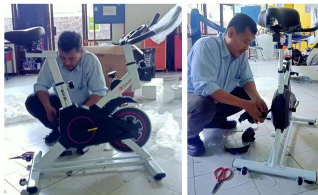
Gambar 3. Proses modifikasi sepeda statis menjadi alat peraga generator.

Oleh karena itu, penggunaan sepeda statis yang dihubungkan dengan kumparan dan magnet ditujukan untuk memberikan pembelajaran yang menyenangkan bagi pengunjung Pos Konservasi Energi yang merupakan siswa sekolah. Para pengunjung siswa yang masih memerlukan alat peraga untuk pembelajaran Fisika-nya di sekolah ini bisa menggunakan alat peraga generator ini untuk mempelajari prinsip kerjanya. Dengan begitu, mereka bisa mempelajari dan menganalisa bagaimana energi gerak manusia bisa menjadi energi listrik yang bisa disimpan di dalam baterai. Dari ilmu pengetahuan yang dipelajari dari teknologi generator ini, pengunjung bisa mengaplikasikannya di lingkungan mereka. Mereka juga bisa menggunakan sumber gerak lain yang bisa dimanfaatkan untuk mendapatkan energi listrik. Selain itu, mereka juga bisa mempelajari bagaimana energi magnet bisa menghasilkan listrik yang kemudian menjadi medan elektromagnetik. Pengimplementasian alat peraga ini juga bisa menuntun siswa untuk lebih kreatif dan peka terhadap pengetahuan, ilmu pengetahuan, dan teknologi yang ada di sekitarnya dan yang sedang dipelajarinya di sekolah.