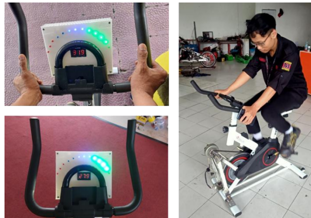
Gambar 5. Pengujian alat peraga generator sepeda statis.

Pengujian dilakukan dengan menggerakkan roda yang bergesekan dengan generator oleh pemeraga. Pada proses ini, keamanan alat peraga diamati. Pengamatan dilakukan pada kemudahan penggunaan fungsi pedal dan putaran roda sepeda statis. Jika putaran roda terasa berat, maka masih ada hambatan pada tegangan listrik atau penggunaan voltase, atau adanya gesekan roda dengan body sepeda. Oleh karena itu, perlu adanya pengaturan ulang untuk rangkaian listrik dan kesesuaian posisi roda dan body. Pengamatan selanjutnya yang dilakukan adalah pemeriksaan pada kebocoran arus listrik pada body. Hal ini dilakukan untuk memberikan keamanan pada pengguna agar tidak tersengat listrik. Faktor mekanik lain juga diamati dalam pengujian ini untuk mendukung keamanan pengguna alat peraga sepeda statis dengan pengaplikasian generator ini. Pengamatan dilakukan pada baut, bearing, dan komponen-komponen lainnya.