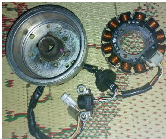
Gambar 1. Kumparan dan magnet yang menggunakan prinsip kerja generator.

Pembuatan alat peraga untuk Pos Konservasi Energi TRS UMM untuk mengatasi kekosongan alat peraga selama dilakukan perbaikan dan perawatan diawali dengan perancangan, penentuan spesifikasi, dan motor penggerak untuk alat peraga generator ini.