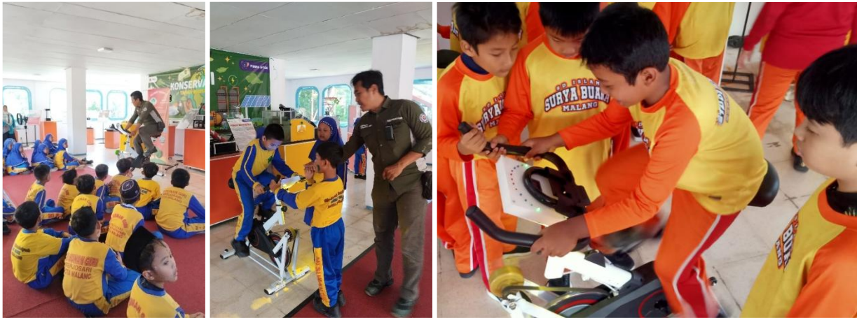
Gambar 8. Pengunjung siswa yang mempunyai rasa ingin tahu akan cara kerja generator dan perubahan energi apa yang terjadi.

Dari pertanyaan ini, pendamping memberikan jawaban dan penjelasan supaya pengunjung siswa bisa memahami konsep energi apa yang terjadi pada sepeda statis yang mereka naiki. Dari penjelasan ini siswa bisa memahami bahwa sumber energi itu bisa disimpan dan diubah untuk menjadi energi lainnya.