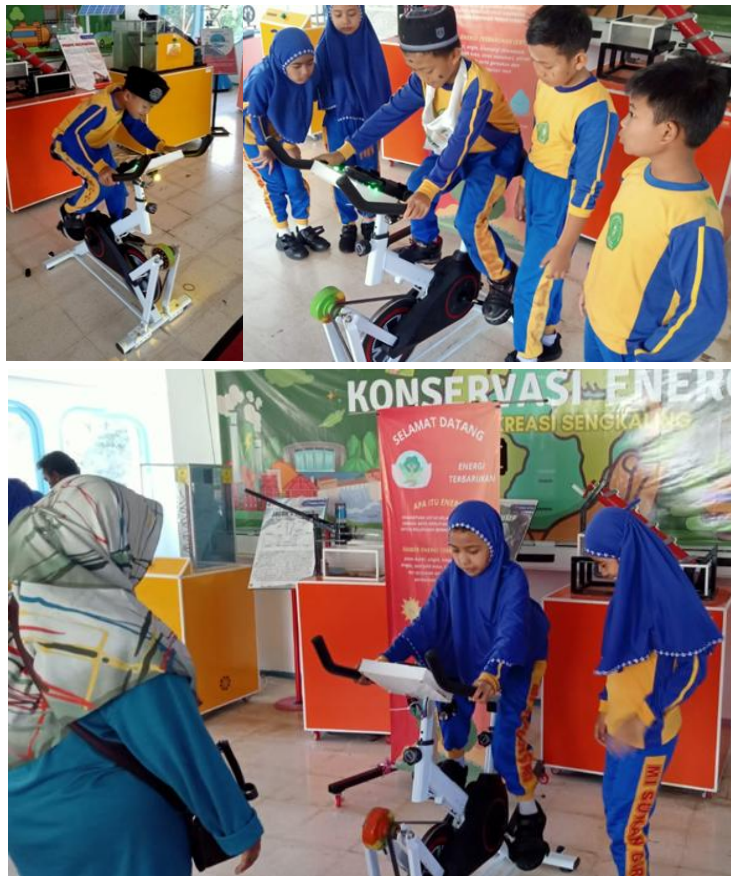
Gambar 7. Pengunjung pelajar yang mempraktekkan perubahan energi pada sepeda statis dengan pengaplikasian generator.

Pos Konservasi Energi TRS UMM menerima kunjungan dari berbagai kalangan, di antaranya adalah pengunjung umum, pendidik, dan pelajar. Beberapa kunjungan yang datang ke Pos Konservasi Energi TRS UMM ketika pengabdian ini dilakukan adalah dari tiga sekolah yang ada di Malang dan Surabaya. Mereka tertarik untuk datang ke Pos Konservasi Energi TRS UMM karena adanya program Eduwisata yang ditawarkan oleh TRS UMM untuk mendukung adanya program sekolah Adiwiyata. Salah satu fasilitas yang diberikan untuk mendukung program Eduwisata adalah adanya Pos Konservasi Energi yang terletak di area tengah TRS UMM, tepatnya berada di kapal yang berlokasi di tengah danau. Ada berbagai macam alat peraga yang ditampilkan di Pos Konservasi Energi ini, salah satunya adalah sepeda statis dengan pengaplikasian generator.