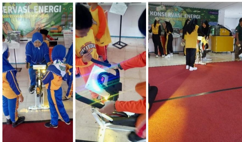
Gambar 9. Pengunjung siswa yang mengamati dan mempelajari perubahan energi pada sepeda statis dengan generator.