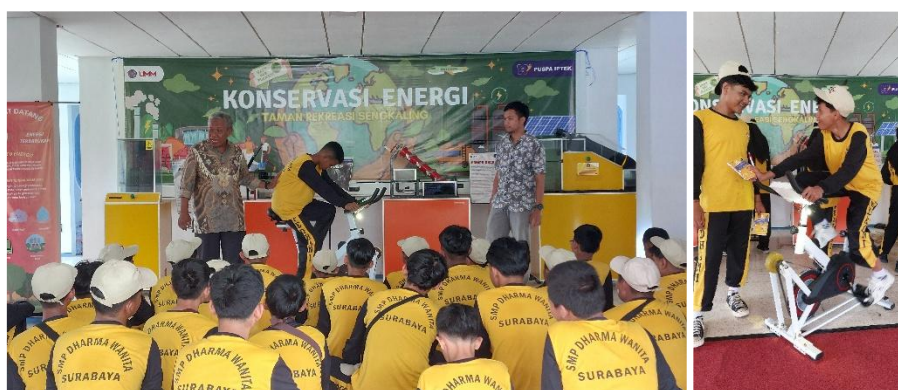
Gambar 10. Pengunjung siswa yang memperhatikan dan memahami penjelasan dari tim pengabdian.

Dari praktek yang dilakukan siswa pada sepeda statis ini, mereka merasa senang bisa belajar sambil bermain dan melakukan praktek langsung untuk mengetahui konsep energi, pemanfaatan, dan pengelolannya. Beberapa siswa membuat catatan untuk bisa mempelajari lagi di rumah atau pun di sekolah. Pertanyaan-pertanyaan yang mereka ajukan bisa menjadi sumber referensi untuk pembelajaran mereka mengenai ilmu pengetahuan alam, khususnya pada konsep energi.