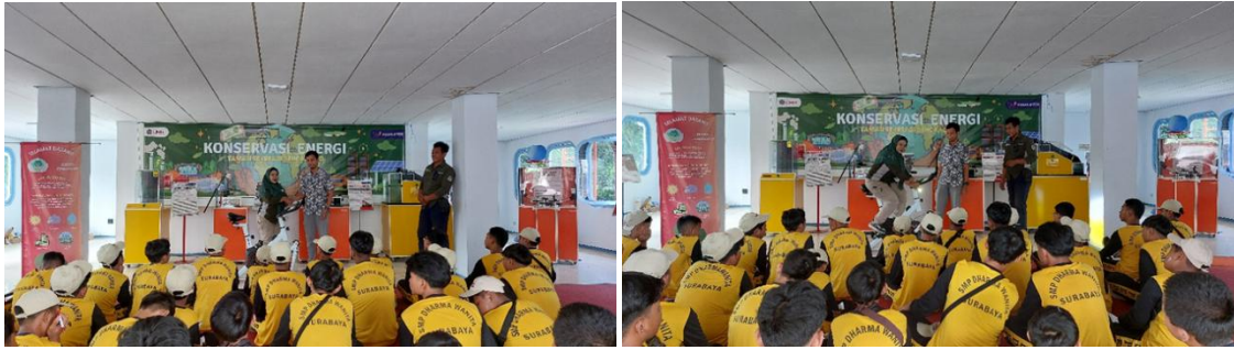
Gambar 6. Serah terima alat peraga ke Pos Konservasi Energi TRS UMM.

Pos Konservasi Energi TRS UMM menerima kunjungan dari berbagai kalangan, di antaranya adalah pengunjung umum, pendidik, dan pelajar. Beberapa kunjungan yang datang ke Pos Konservasi Energi TRS UMM ketika pengabdian ini dilakukan adalah dari tiga sekolah yang ada di Malang dan Surabaya. Mereka tertarik untuk datang ke Pos Konservasi Energi TRS UMM karena adanya program Eduwisata yang ditawarkan oleh TRS UMM untuk mendukung adanya program sekolah Adiwiyata. Salah satu fasilitas yang diberikan untuk mendukung program Eduwisata adalah adanya Pos Konservasi Energi yang terletak di area tengah TRS UMM, tepatnya berada di kapal yang berlokasi di tengah danau. Ada berbagai macam alat peraga yang ditampilkan di Pos Konservasi Energi ini, salah satunya adalah sepeda statis dengan pengaplikasian generator.