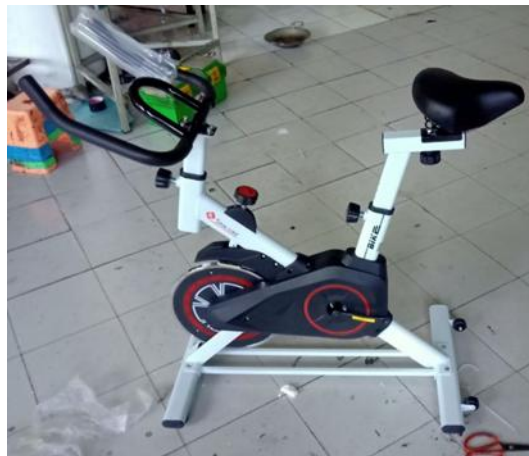
Gambar 2. Sepeda statis yang akan dihubungkan dengan kumparan dan magnet.

Sepeda statis dipilih dalam program pengabdian ini untuk alat peraga generator karena bisa dimodifikasi dengan menggunakan prinsip kerja generator dengan mengintegrasikan elemen-elemen kunci dari sistem Generator ke dalam mekanisme sepeda statis. Generator adalah jenis motor listrik yang memanfaatkan prinsip pengisian baterai melalui energi yang dihasilkan dari putaran magnetik dan penggunaan coil (kumparan) dengan mode pulsa.