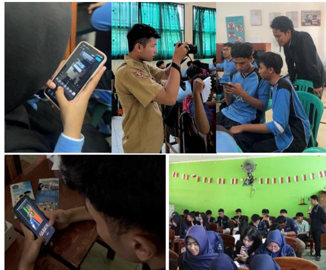
Gambar 3. Sesi Pendampingan Praktik Produksi Video Kreatif.

Sesi Review video dilakukan untuk memberikan umpan balik terhadap karya peserta serta memperkuat pemahaman penerapan hak cipta dalam produksi media.