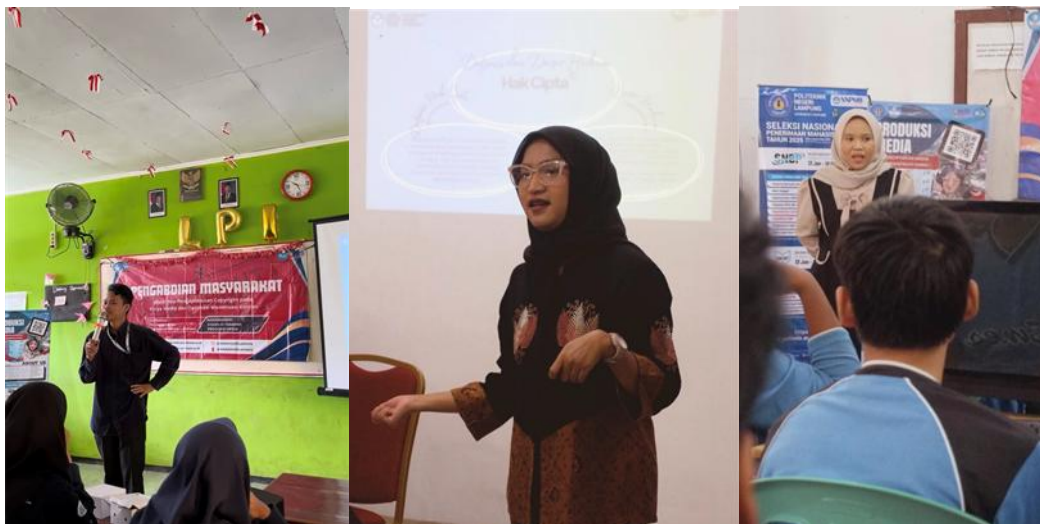
Gambar 1. Pemaparan Materi Workshop oleh Dosen S1 Terapan Produksi Media.

Workshop dilaksanakan melalui kombinasi penyampaian materi, pendampingan praktik produksi video, serta sesi evaluasi hasil karya peserta.