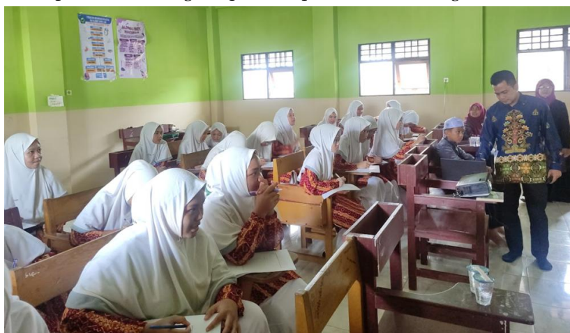
Gambar 2. Peserta PKM sedang Latihan praktik membuat surat resmi secara langsung.