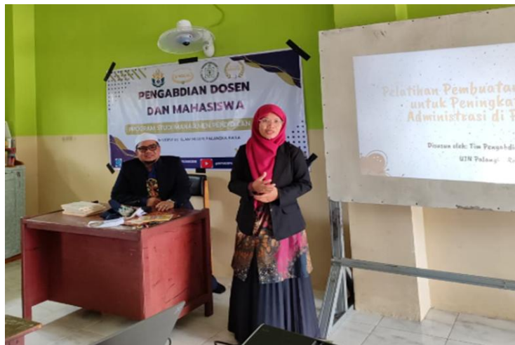
Gambar 1. Penyampaian Materi dengan metode ceramah oleh Tim PKM.

Kegiatan pelatihan pembuatan surat resmi bagi anggota OSIM Pesantren Darul Ilmi dilaksanakan dalam bentuk workshop selama dua hari. Peserta berjumlah 25 orang yang terdiri dari pengurus inti dan bidang-bidang OSIM. Pelatihan diawali dengan pre-test untuk mengukur pemahaman awal peserta mengenai format, bahasa, dan kelengkapan surat resmi. Hasil pre-test menunjukkan bahwa mayoritas peserta (72%) belum memahami komponen surat resmi dengan benar, terutama dalam hal penempatan nomor surat, penggunaan bahasa formal, serta kelengkapan lampiran. Setelah dilakukan pre-test , tim menyampaikan materi. Materi pelatihan disampaikan dalam bentuk ceramah interaktif, diskusi, tanya jawab dan praktik langsung.