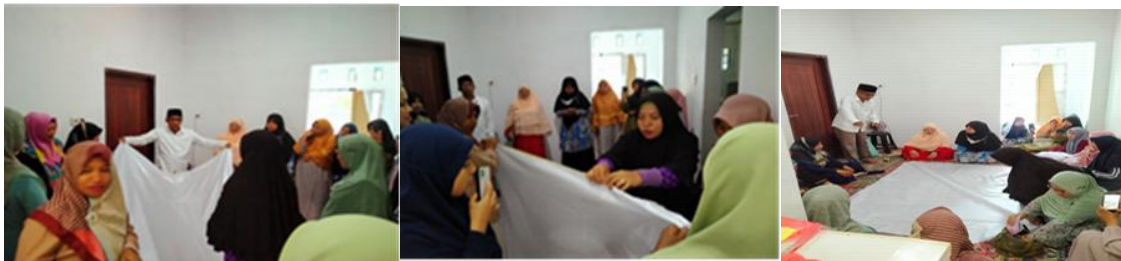
Gambar 2. Aktifitas Pelatihan Penyelenggaraan Jenazah Pada Majelis Taklim Nurul Qalbi Kelurahan Penkase Oeleta kecamatan Alak Kota Kupang.

2. Tahapan kedua, adalah tahapan cara mengafani jenazah yang dilakukan dengan baik, dan langkah-langkah yang dilakukan meliputi :