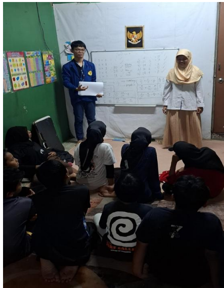
Gambar 1. Tim PKM USM dan Mahasiswa memberikan penjelasan pada murid-murid sanggar bimbingan.