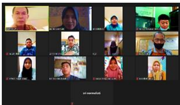
Gambar 2. Kegiatan Pengabdian Masyarakat 28 Agustus 2020

Pada saat pelatihan, mayoritas guru menerima dengan positif materi yang diberikan narasumber. Sebagian besar dari peserta begitu antusias mengikuti pelatihan. Mereka banyak yang menyatakan jika masih banyak yang belum mengerti tentang PTK ataupun pelaksanaannya. Bahkan dari mereka tidak mengerti untuk apa dilakukannya PTK bagi guru. Mereka hanya menganggap PTK diperlukan untuk kenaikan pangkat ataupun untuk sertifikasi guru. Hal ini tentunya membuka wawasan guru dan kesadaran guru bahwa pentingnya guru memiliki pengetahuan dan membuat penelitian tindakan kelas. Ketidapahaman para guru mengenai penelitian tindakan kelas merupakan hambatan yang mereka alami.