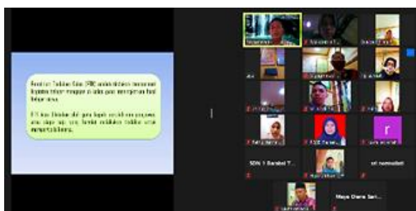
Gambar 3. Kegiatan Pengabdian Masyarakat 29 Agustus 2020

Secara umum, pelatihan yang telah dilaksanakan mampu meningkatkan pemahaman guru di SD Kecamatan Barabai Kabupaten Hulu Sungai Tengah. Antusiasme guru dalam mengikuti pelatihan diikuti dengan peningkatan pemahaman yang diharapkan menjadi modal dasar bagi guru untuk melakukan inovasi dalam kegiatan pembelajaran serta mampu menuangkannya ke dalam bentuk laporan tindakan penelitian kelas.