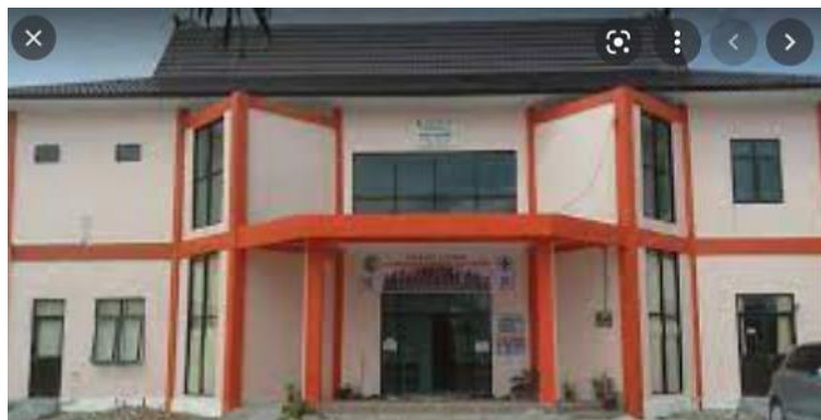
Gambar 1. UPT Puskesmas Marina Permai Kota Palangka Raya

Kegiatan ini dilaksanakan di Wilayah Kerja UPT Puskesmas Marina Permai Kota Palangka Raya. UPT Puskesmas Marina Permai memiliki beberapa batas wilayah kerja dimana di sebelah utara berbatasan dengan Kelurahan Pahandut Seberang, sebelah selatan berbatasan dengan Kelurahan Sabaru, sebelah timur berbatasan dengan Kelurahan Pahandut dan sebelah barat berbatasan dengan Kelurahan Palangka dan Menteng. Puskesmas Marina Permai berlokasi di Jalan Marina Permai No.65 Kelurahan Langkai Kecamatan Pahandut Kota Palangka Raya dan memiliki luas wilayah kerja sebesar 10.000 km 2 , terdiri dari 1 Kelurahan dengan jumlah penduduk sebesar 41.426 jiwa, sedangkan jumlah Kepala Keluarga (KK) sebanyak 8.327 KK.