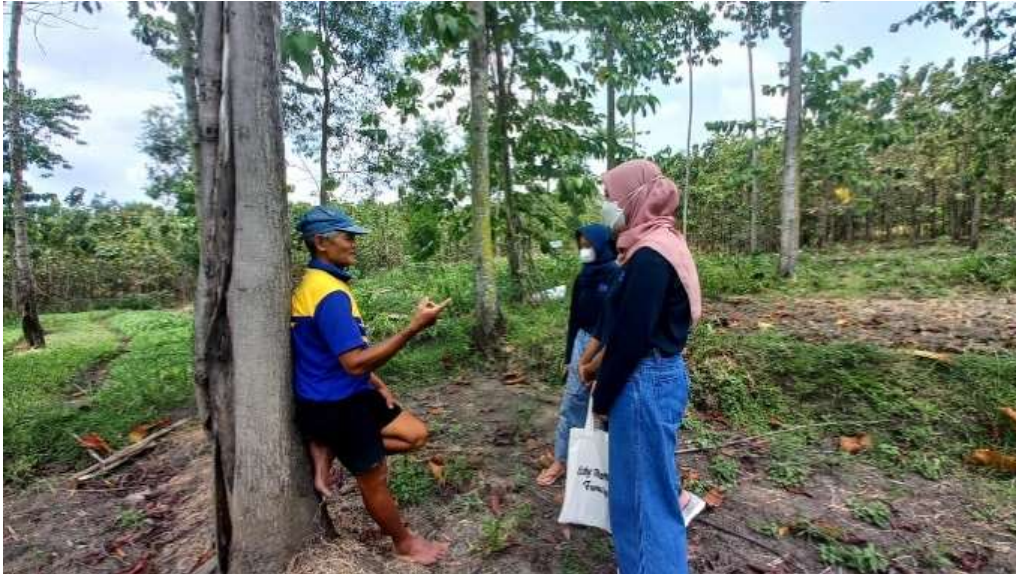
Gambar 3. Kegiatan sharing pengendalian hama dan penyakit tanaman

Pada kesempatan ini, mahasiswa menyampaikan informasi mengenai banyaknya pestisida nabati yang dijual di pasaran sehingga petani tidak perlu membuat pestisida sendiri. Hal ini akan lebih memudahkan petani yang ingin beralih ke pestisida nabati yang lebih ramah lingkungan karena sebagian besar petani menghabiskan waktunya di lahan sehingga tidak memiliki kesempatan untuk membuat pestisida nabati sendiri. Langkah preventif yang dapat dilakukan untuk mencegah serangan OPT ini adalah dengan melakukan rotasi tanaman. Makarim et al. (2017), menyatakan bahwa banyak sekali manfaat dari penerapan rotasi tanaman dalam setahun, baik terhadap kesuburan lahan, produktivitas dan produksi pertanian, peningkatan pendapatan, serta pengurangan serangan hama penyakit tanaman sehingga usaha tani lebih berkelanjutan.