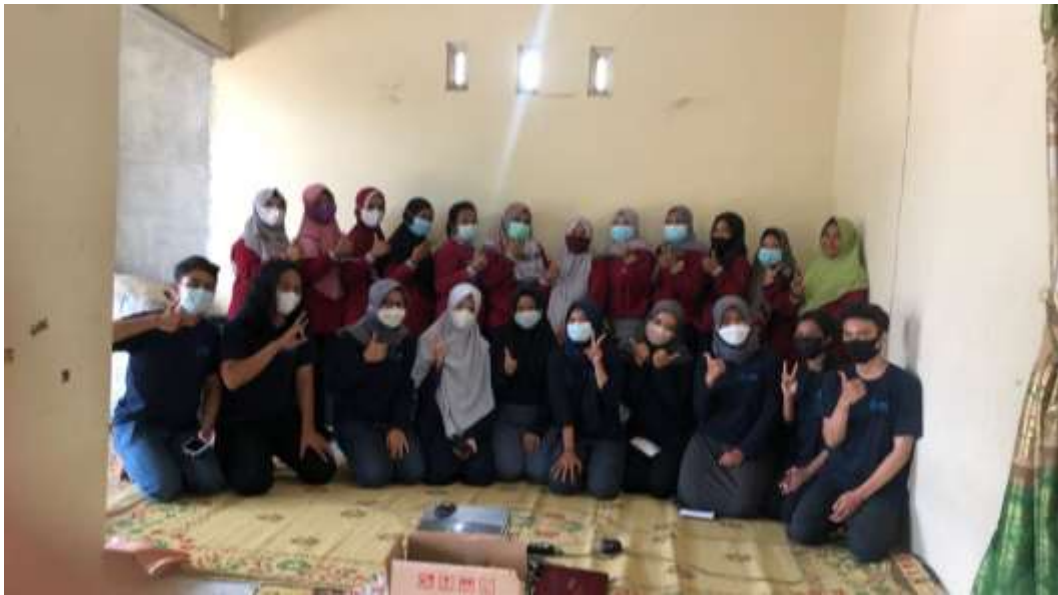
Gambar 8. Kegiatan diskusi bersama pengembangan masyarakat

Kegiatan FGD dilakukan dengan membagi tiga kelompok yang terdiri atas anggota KWT dan mahasiswa. Mahasiswa pada masing-masing kelompok memandu jalannya diskusi dengan menanyakan keadaan yang ada di KWT Jesa Karya. Setelah menampung permasalahan internal dari KWT Jesa Karya, kemudian acara berikutnya adalah diskusi terkait solusi apa yang dapat diberikan dan dilakukan anggota KWT Jesa Karya, seperti dengan mengadakan kegiatan lain selain menanam dan panen yaitu dengan studi banding ke kelompok tani lain. Diskusi ini penting dilakukan bersama dengan anggota KWT Jesa Karya, karena dalam penyelesaian masalah yang ada sasaran utamanya yaitu pihak KWT sendiri sehingga solusi-solusi yang muncul akan lebih cocok dan diterima. Menurut Ruhimat (2021), diskusi dapat dilakukan dengan berbagai pihak melalui focus group discussion (FGD) sebanyak 30 orang peserta. Diskusi (saling bertukar pendapat) dilakukan untuk pertukaran tentang berbagai permasalahan yang dihadapi anggota dalam usahatani pada KWT Jesakarya.