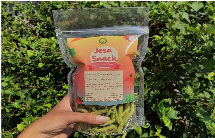
Gambar 5. Produk olahan pascapanen

Kegiatan pengolahan hasil panen dilakukan untuk menambah pengetahuan para anggota KWT Jesa Karya agar mampu mengolah hasil panen dengan berbagai variasi sehingga nilai jual hasil panen menjadi meningkat. Kegiatan dilakukan oleh KWT Jesa Karya bersama mahasiswa MBKM dan HKTI Pemuda Tani. Pada keberjalanan kegiatan pengolahan hasil panen anggota KWT Jesa Karya sangat antusias dengan semangat dan rasa ingin tahu yang tinggi. Adanya kegiatan pengolahan pascapanen ini dapat menaikkan nilai jual hasil panen. Berdasarkan penelitian Ihsan et al. (2021), menunjukkan bahwa hasil panen yang langsung dijual kepada pengepul dibeli dengan harga yang ditetapkan pengepul. Umumnya harga jual tersebut cukup fluktuatif tergantung dengan harga pasar. Harga jual yang berfluktuasi berdampak pada penghasilan petani, tidak jarang petani mengalami kerugian. Masyarakat dapat meningkatkan penghasilan dengan cara mengolah hasil panen sehingga memiliki nilai tambah dan harga jual hasil pertanian dan olahannya lebih tinggi.