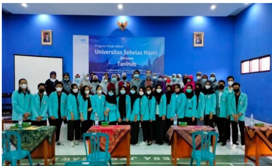
Gambar 1. Sosialisasi bersama KWT Jesa Karya

Kegiatan sosialisasi yang dilakukan bersama dengan KWT Jesa Karya dilaksanakan dengan menyampaikan beberapa pokok materi yang meliputi perencanaan pembiayaan usaha tani, pemasaran digital, perencanaan budidaya, serta pengendalian hama dan penyakit tanaman. Kelompok Wanita Tani (KWT) Jesa Karya merupakan salah satu kelompok tani yang beranggotakan para wanita yang berdomisili di wilayah Jeruk Sawit, Gondangrejo, Karanganyar. TaniHub dikenalkan sebagai mitra para petani dalam permodalan maupun pemasaran pascapanen. TaniHub merupakan perusahaan dan aplikasi di bidang pertanian berbasis aplikasi digital di Indonesia. TaniHub adalah e-commerce untuk hasil tani yang bertujuan untuk menghubungkan petani dengan berbagai jenis usaha dan end-user.