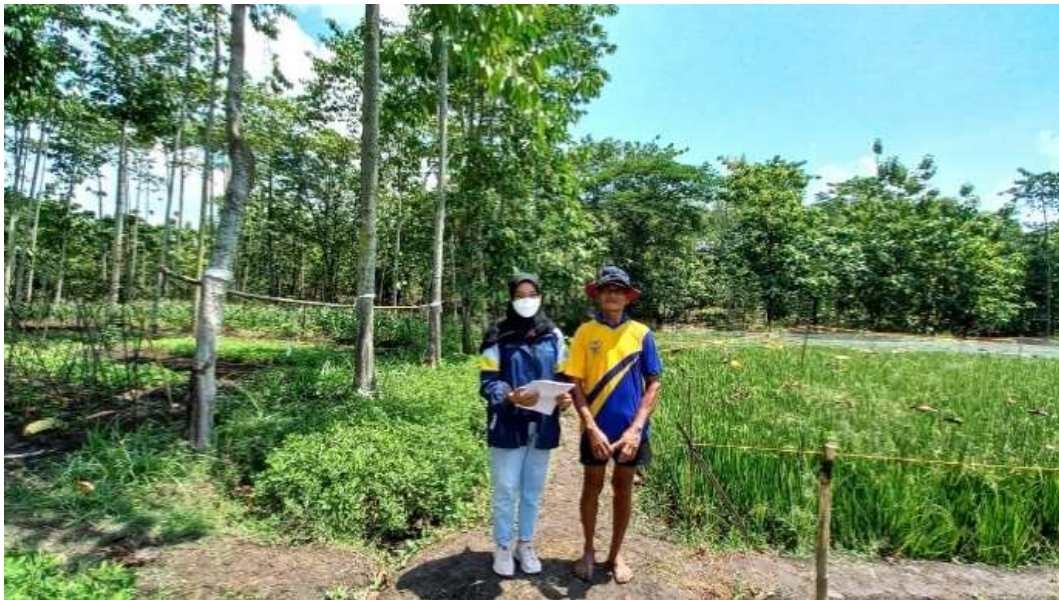
Gambar 2. Kegiatan observasi lahan petani

Implementasi dari materi yang disampaikan dalam sosialisasi dilakukan melalui kegiatan observasi lahan. Kegiatan ini dilakukan dengan mendatangi beberapa lahan pertanian yang digarap oleh petani. Kegiatan ini dilakukan dengan tujuan untuk mengetahui kondisi lahan dan permasalahan dalam usaha tani on-farm yang dialami oleh para anggota KWT Jesa Karya. Hasil observasi didapatkan data bahwa sebagian besar petani melakukan budidaya tanaman sayur-sayuran seperti jagung, kakung, sawi, bayam, kacang panjang, dan terung yang ditanam dalam setiap bedengan. Kebanyakan lahan petani ditanami dengan sistem tumpangsari. Luas lahan yang digunakan untuk usaha tani tidak sama antara petani satu dengan lainnya.