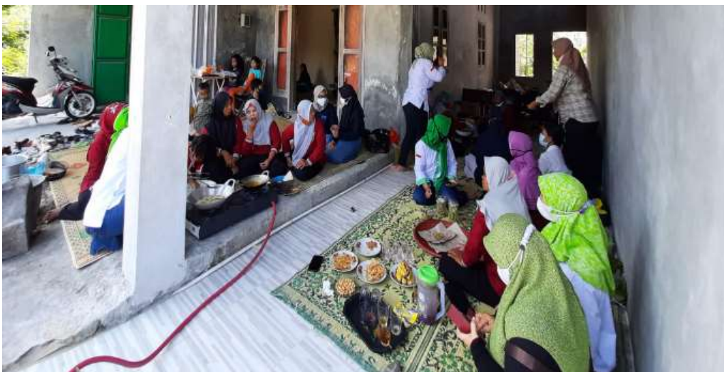
Gambar 4. Kegiatan pengolahan produk pascapanen

Komoditas yang ditanam oleh KWT Jesa Karya yaitu tanaman sayuran seperti kangkung, bayam, dan terung, serta tanaman rimpang seperti jahe. Berbagai hasil pertanian tersebut langsung dijual kepada tengkulak tanpa melalui tahapan pengolahan pascapanen. Menurut Indrayani et al. (2019), tidak ada proses pengolahan berdampak pada rendahnya harga jual karena tidak mempunyai nilai tambah. Sebagian besar petani hanya bertindak sebagai petani saja, artinya kegiatan yang dilakukan hanya terbatas pada kegiatan menanam, merawat tanaman, memanen, dan kemudian menjualnya sehingga pendapatan yang didapatkan oleh petani terbatas dari hasil penjualan saja.