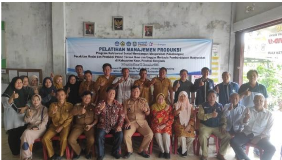
Gambar 8. Pelatihan manajemen produksi

Berdasarkan data Tabel 1 peserta yang memperoleh nilai 1 sampai 2 ada 0 orang, peserta yang memperoleh nilai 3 sampai 4 ada 5 orang, peserta yang memperoleh nilai 5 sampai 6 ada 9 peserta dan peserta yang memperoleh nilai 7 sampai 8 ada 1 peserta. Berdasarkan perolehan nilai ini, maka jelas bahwa pengetahuan peserta tentang mesin industri pelet dan PLTS masih belum memahami, berikut grafik batang hasil tes awal, dapat dilihat pada Gambar 9.