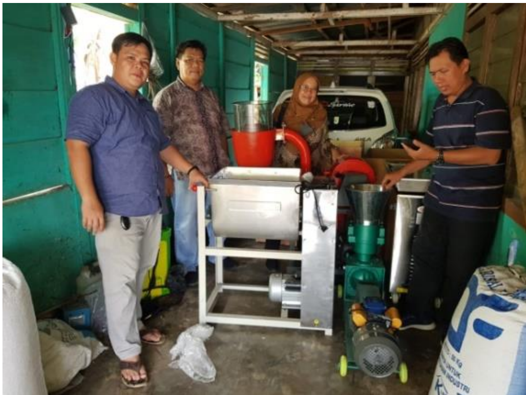
Gambar 4. Hasil perakitan semua mesin

Metode pelaksanaan yang dilakukan terdiri dari empat langkah yaitu persiapan alat, perakitan alat, ujicoba mesin dan produksi, pelatihan dan cetak pelet. Pada tahap persiapan alat yaitu mengajak dan berkoordinasi bersama Bumdes bahwa mesin penggiling jagung, mesin penggiling keong, PLTS dan mesin pencetak pelet akan siap untuk dirakit, setelah tahap persiapan alat maka masuk ke tahap perakitan alat. Pada tahap ini tim pengabdian Kosabangsa bersama-sama dengan Bumdes dan masyarakat setempat untuk merakit semua mesin agar dapat dioperasikan, metode pelaksanaan dilakukan di Desa Silika 2 Kecamatan Tanjung Kemuning, tepatnya pada tanggal 8 Desember 2022, hasil perakitan semua mesin dapat dilihat pada Gambar 4.