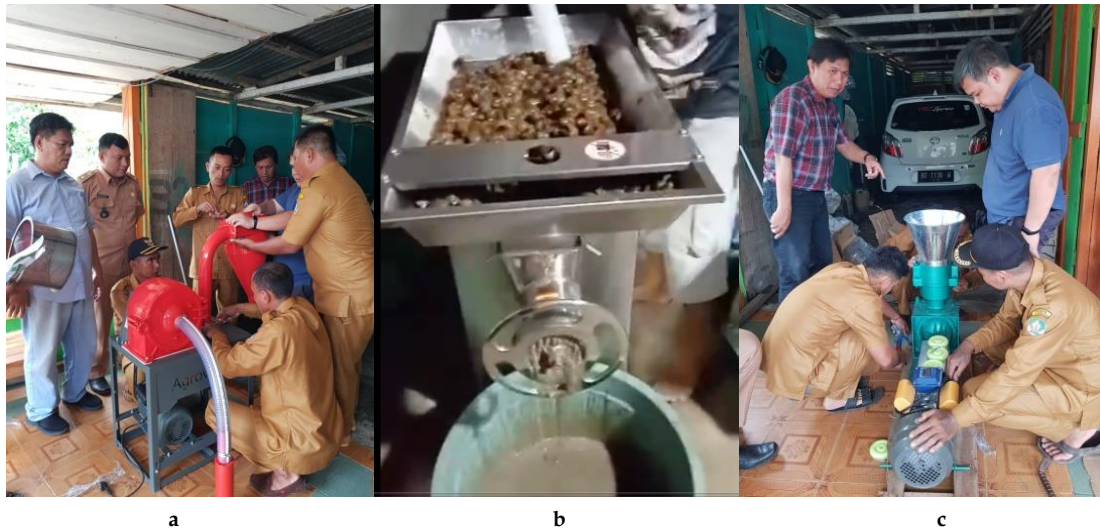
Gambar 1. (a) Mesin penggiling jagung, (b) keong, dan (c) mesin pencetak pelet

Metode kegiatan pengabdian Kosabangsa ini terdiri dari 2 bagian yaitu alat dan bahan serta metode pelaksanaan. Alat yang digunakan berupa mesin penggiling Jagung (penepung jagung) dapat dilihat pada Gambar 1a, ada juga mesin penggiling keong mas dapat dilihat pada Gambar 1b. Untuk alat mesin cetak peletnya memiliki spesifikasi sebagai berikut Tipe Mesin CTK-P150, Merek Agrowindo, Kapasitas 100-150 kg/jam, Dimensi 155x50x106 cm, Power 12 Hp, dan Bahan Plat Mild Steel. Gambar 1c merupakan mesin pencetak pelet/pakan ikan.