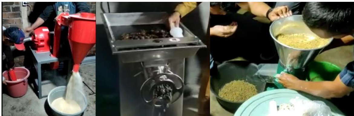
Gambar 6. Uji coba alat/mesin

Tahap selanjutnya yaitu uji coba mesin dan industri, pada tahap ini diharapkan semua mesin industri pakan dapat berjalan dan bekerja sebagai fungsinya masing-masing, gambar ujicoba mesin industri pelet dapat dilihat pada Gambar 6.