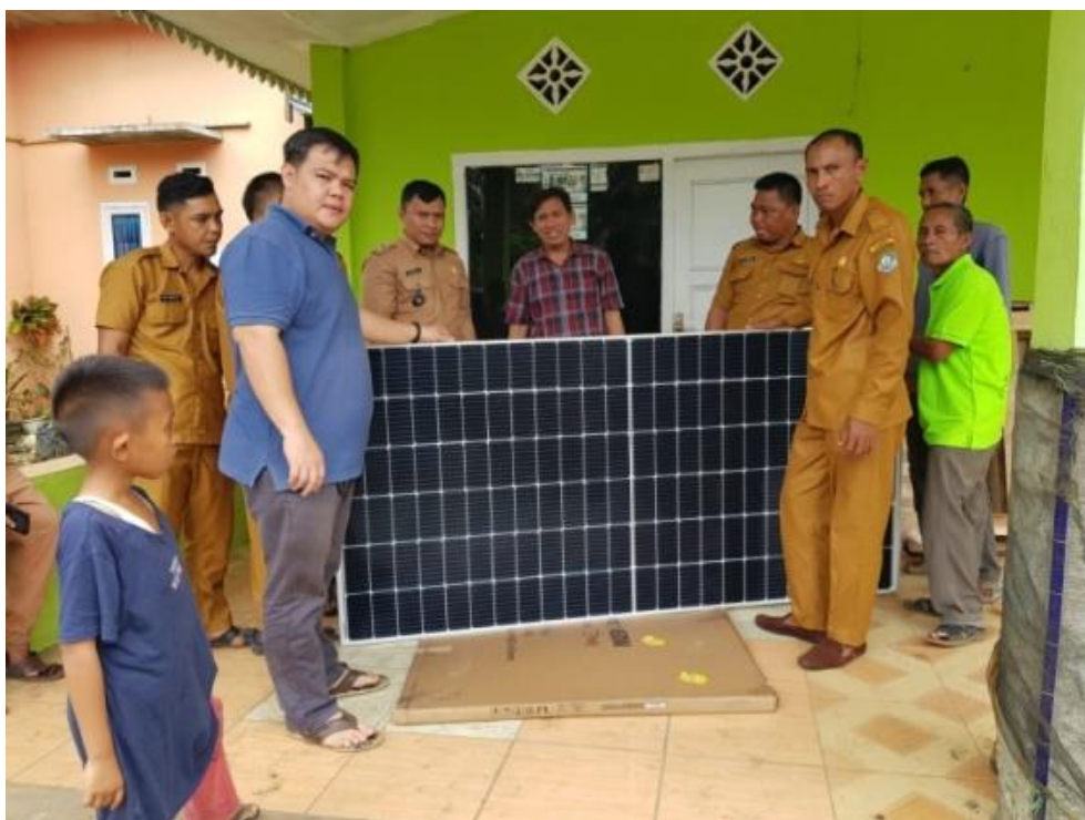
Gambar 2. PLTS dengan Kapasitas 2 MWP

Sumber energi listrik untuk menghidupkan atau menjalankan mesin produksi pelet berasal dari PLTS (Pembangkit Listrik Tenaga Surya) dengan besar kapasitas sebesar 2000 Watt-Peak (2MWP) yang di- Hybrid -kan dengan PLN jika musim hujan intensitas matahari akan berkurang dapat dibantu oleh PLN. Gambar PLTS dapat dilihat pada Gambar 2.