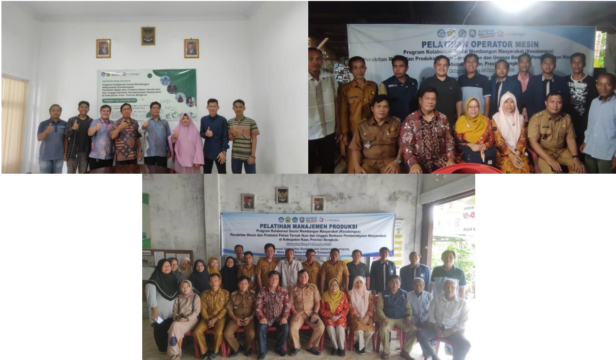
Gambar 11. Pelaksanaan Pengabdian Pada Masyarakat Skema Kosabangsa

Berikut ini adalah dokumentasi Pengabdian Kepada Masyarakat sengan skema Kosabangsa yang telah dilaksanakan. Dapat dilihat pada Gambar 11.