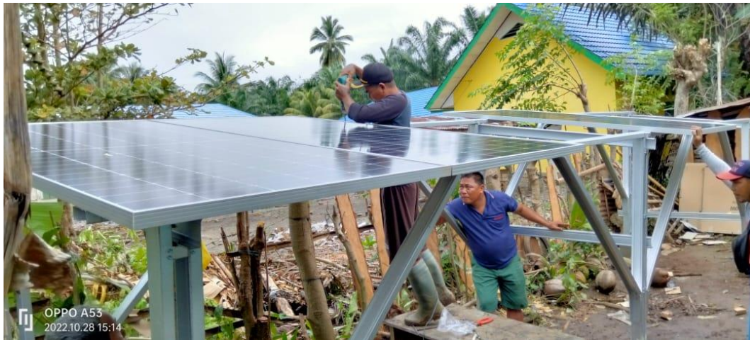
Gambar 5. Perakitan PLTS

Tahap selanjutnya yaitu uji coba mesin dan industri, pada tahap ini diharapkan semua mesin industri pakan dapat berjalan dan bekerja sebagai fungsinya masing-masing, gambar ujicoba mesin industri pelet dapat dilihat pada Gambar 6.