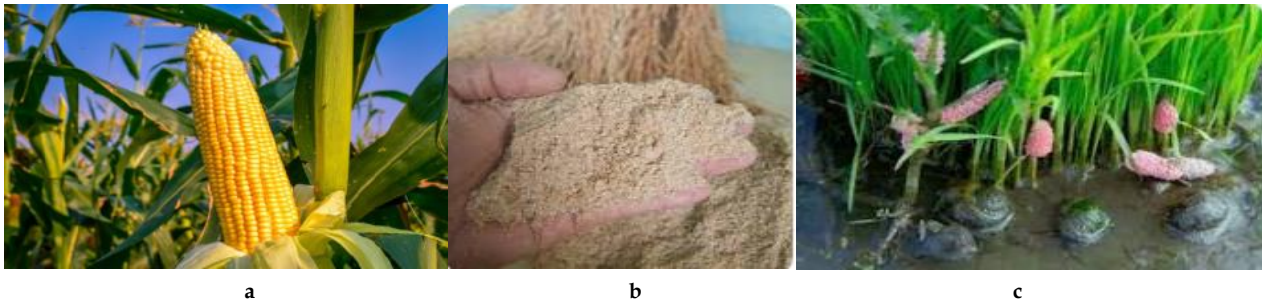
Gambar 3. Semua bahan baku pembuatan pelet: (a) padi, (b) dedak, dan (c) keong mas

Bahan yang digunakan untuk produksi industri pelet ini adalah jagung, padi (dedak), dan hama keong mas, semua bahan dapat dilihat pada Gambar 3.