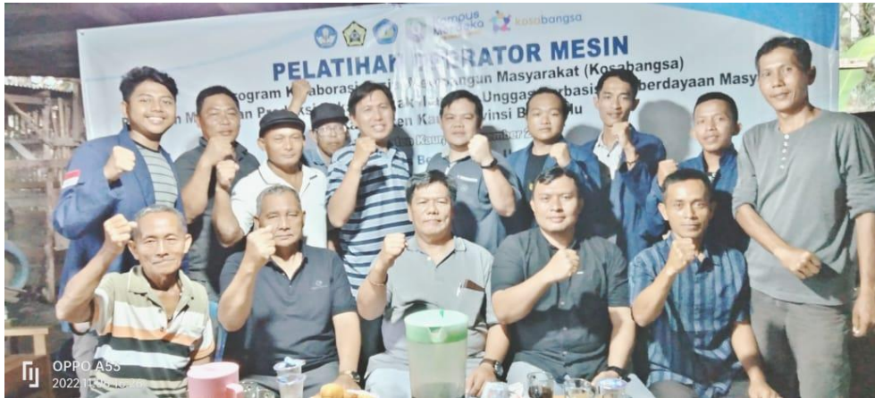
Gambar 7. Pelatihan operator mesin

dan PLTS sebagai sumber energi listrik terbarukan ternyata hasilnya masih rendah pengetahuannya tentang mesin industri pelet dan PLTS sebagai sumber energi listrik terbarukan. Berdasarkan tes awal yang telah dilaksanakan ternyata hanya 1 orang yang memiliki nilai baik ini juga karena latar belakang dari peserta yaitu strata 1 tamatan Prodi Elektro dari 15 peserta yang lain, berikut hasil pretest peserta pelatihan mesin industri pelet.