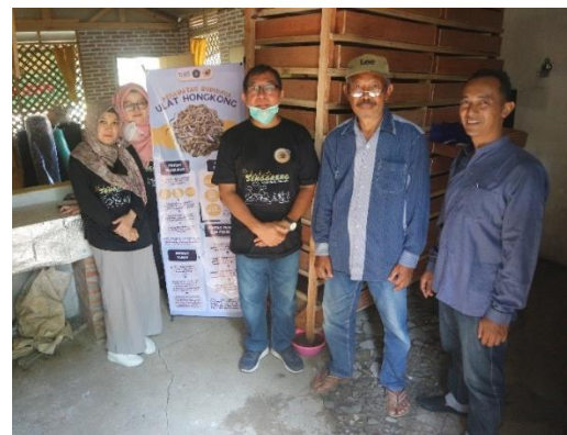
Gambar 3. Kegiatan edukasi dan penyuluhan kepada mitra pengabdian.

Selain memberikan solusi berupa penyediaan alat dan pelatihan, edukasi masyarakat menjadi langkah investasi yang berkelanjutan. Pelatihan budidaya dan metode usaha budidaya ulat hongkong dilakukan setelah kandang dan media disiapkan. Kegiatan edukasi dan pelatihan menghadirkan praktisi pembudidaya ulat hongkong dari Kabupaten Malang, yang telah berkecimpung dalam budidaya ulat hongkong selama lebih dari sepuluh tahun. Edukasi dan penyuluhan bertujuan untuk memberikan pemahaman kepada mitra mengenai metode budidaya ulat hongkong, pemasaran hingga prospeksi sosial ekonomi. Dalam kegiatan ini juga dilakukan evaluasi oleh edukator terhadap biopond dan perkembangan ulat hongkong yang telah dibangun bersama mitra. Secara lebih detail, kegiatan pelatihan meliputi :