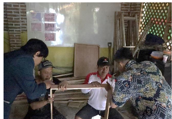
Gambar 2. Pembuatan biopond ulat hongkong bersama anggota kelompok masyarakat.

Alternatif pakan ikan dengan biaya murah adalah solusi yang sangat diperlukan oleh masyarakat kelompok usaha. Salah satu pakan ikan alternatif yang sangat menarik untuk dikembangkan adalah insect-based fish meals atau pakan ikan berbahan dasar serangga menggunakan larva ulat hongkong. Berbagai penelitian dan eksplorasi telah dilakukan untuk menggali potensi serangga sebagai sumber pangan dengan tetap memperhatikan nilai nutrisi seperti protein dan lemak, serta seminimal mungkin memberikan efek pada pertumbuhan ikan yang akan mempengaruhi hasil dan waktu panen (Gasco et al. , 2014).