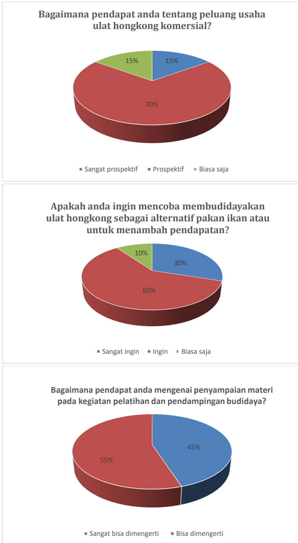
Gambar 5. Beberapa respon dari mitra pengabdian terhadap kegiatan pengabdian inisiasi budidaya ulat hongkong di kelompok masyarakat "Sumber Duren".