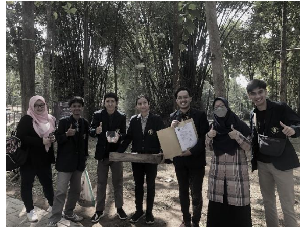
Gambar 1. Kegiatan diskusi identifikasi masalah dan perencanaan kegiatan bersama anggota kelompok masyarakat “Sumber Duren”

Berdasarkan latar belakang permasalahan yang dihadapi oleh mitra, diputuskan bahwa persoalan pakan merupakan faktor krusial yang perlu segera dipecahkan. Untuk itu, diperlukan teknologi penyediaan pakan alternatif yang murah, efisien dan berkelanjutan. Salah satu sumber pakan alternatif kaya protein yang dapat dikembangkan sebagai pakan ikan adalah pakan berbasis serangga. Berbagai penelitian terkait pakan alternatif berbasis serangga telah dikembangkan selama lebih dari lima belas tahun terakhir. Alfiko et al. (2022) membahas potensi dan uji coba pemberian pakan berbasis serangga sebagai sumber protein alternatif dalam sistem akuakultur. Salah satu serangga yang menjanjikan dalam hal ini adalah ulat hongkong ( T. molitor ). Sebuah review oleh