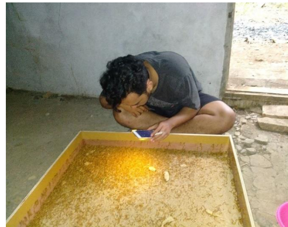
Gambar 4. Kegiatan pemeliharaan, sortasi indukan dan pemisahan hama pada budidaya ulat hongkong