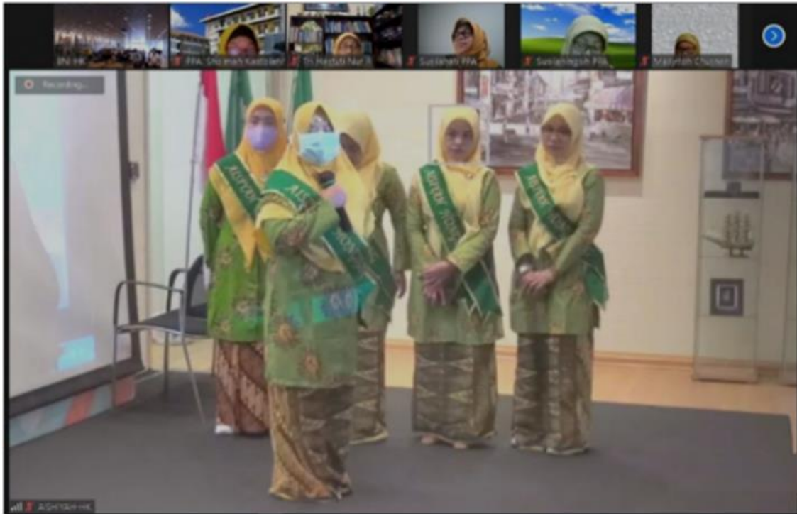
Gambar 1. Pelantikan Pengurus PCIA Hong Kong.