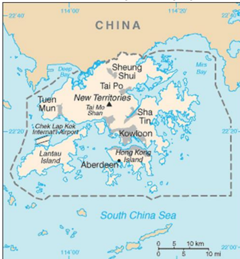
Gambar 2. Peta Negara Hong Kong.

Hong Kong memiliki luas wilayah sebesar 1.104 km 2 yang terdiri dari 18 distrik yang mana dari seluruh kota di Hong Kong tersebar PMI yang berasal dari Indonesia. Negara Hong Kong menjadi negara tujuan yang sering dipilih oleh PMI asal negara Indonesia (Viva Budy Kusnandar, 2022).