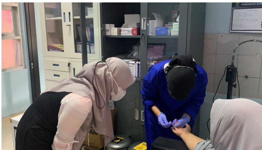
Gambar . Pemeriksaan Triple Eliminasi

Berdasarkan tabel diatas dapat disimpulkan bahwa ibu hamil yang diperiksa triple eliminasi dengan hasil menunjukkan non reaktif penyakit HIV-AIDS, sifilis dan hepatitis B. Pemeriksaan triple eliminasi dilakukan oleh petugas laboratorium.