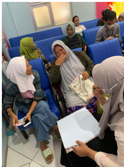
Gambar 1. Proses FGD oleh Tim PKM dan Dosen

Berdasarkan tabel diatas dapat disimpulkan bahwa terdapat peningkatan pengetahuan sebelum dan setelah pemberian edukasi. Sebelum diberikan edukasi ibu hamil memiliki pengetahuan kurang sebanyak 50% sementara setelah diberikan edukasi pengetahuan meningkat menjadi 76,3% berpengetahuan baik. Hasil pengabdian ini sejalan dengan hasil beberapa penelitian yang menunjukkan adanya peningkatan pengetahuan ibu hamil tentang triple eliminasi setelah diberikan pendidikan Kesehatan (Nuraeni dkk, 2023; Yuni dkk, 2023; Herlambang dkk, 2021).