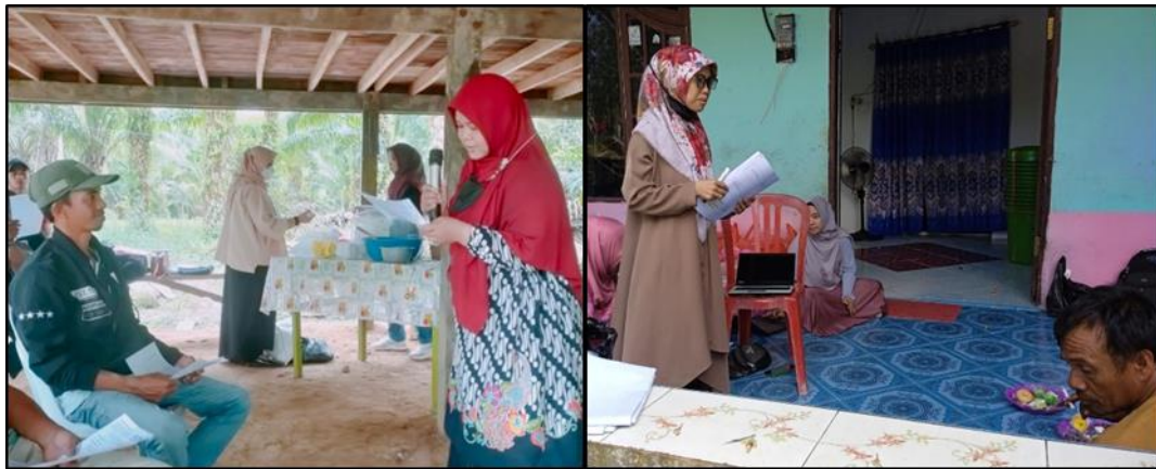
Gambar 3. (A) Sosialisasi dan (B) Bimbingan teknis.

Bimbingan teknis berfokus pada perhitungan breakeven point dalam unit, menghitung breakeven point dalam rupiah dan menghitung minimal penjualan yang harus dicapai dengan berdasar pada target laba. Skala bisnis yang menguntungkan yang dihasilkan dari kelayakan bisnis yang akan berdampak pada pengambilan kebijakan atau strategi bisnis yang diperlukan serta keberlangsungan usaha. Teknis pelaksanaan bimtek bagian ketiga ini adalah memberikan review awal dan penjelasan tentang analisis kelayakan usaha pada mitra, menyangkut aspek finansial, pemasaran, manajemen, dan hukum, melakukan analisis kelayakan usaha pada usaha yang dijalankannya serta evaluasi dan pendampingan atas analisis kelayakan usaha yang disusun. Kegiatan bimbingan teknis diakhiri dengan pengenalan hotel lebah, bahan yang dibutuhkan dan cara pembuatannya.