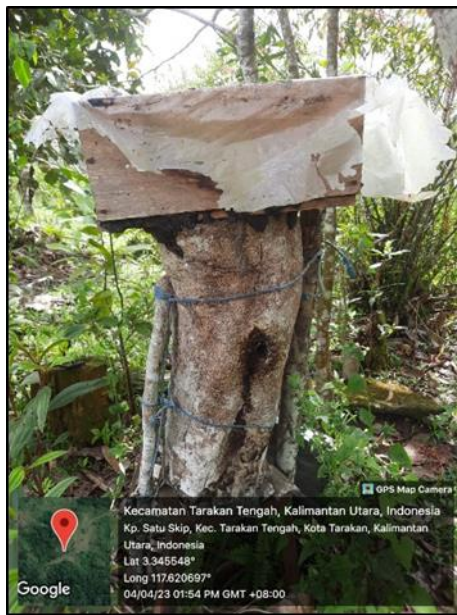
Gambar 2. Peletakan sarang madu kelulut.

makanan berupa tanaman berbunga yang dapat memberikan nektar dan serbuk sari. Berdasarkan hal tersebut, maka permasalahan ini belum selesai.