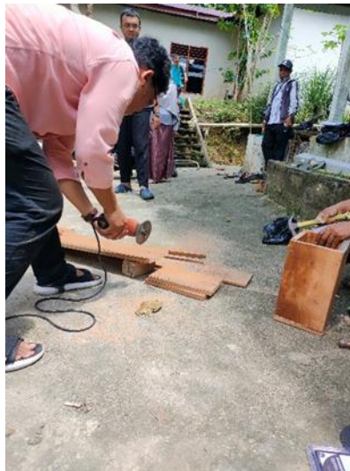
Gambar 5. Kegiatan instalasi hotel lebah.

80 cm dan lebar penampang 30 cm. Hal ini bertujuan agar hotel mudah dipindahkan dan diletakkan di lokasi yang sesuai guna optimalisasi produksi madu.