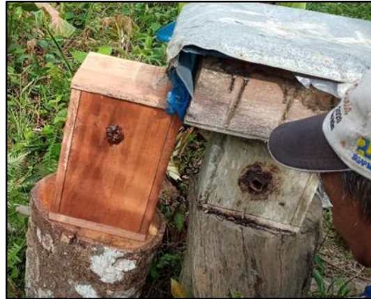
Gambar 6. Pebandingan kondisi hotel dan sarang.