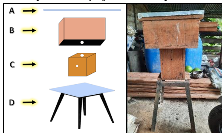
Gambar 4. (A) Desain hotel lebah dan (B) Hotel lebah.

Spesifikasi hotel lebah seperti terlihat pada Gambar 4 yang terdiri atas 4 komponen.