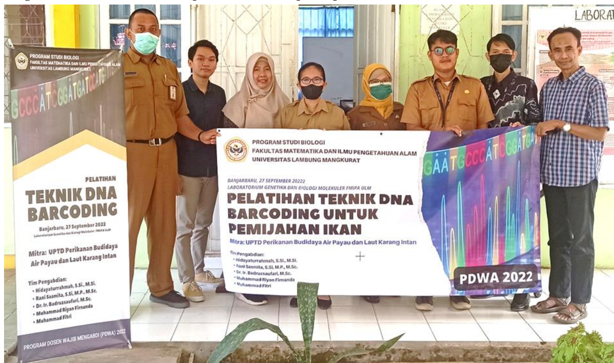
Gambar 1. Dokumentasi peserta dan tim pengabdian di Laboratorium Genetika dan Biologi Molekuler FMIPA Universitas Lambung Mangkurat.

Kegiatan pelatihan "Introduksi DNA Barcoding untuk Pemijahan Ikan bagi Staf UPTD Perikanan Budidaya Air Payau dan Laut Karang Intan" telah dilaksanakan selama satu hari, yaitu pada hari Selasa tanggal 27 September 2022 bertempat di Laboratorium Genetika dan Biologi Molekuler FMIPA Universitas Lambung Mangkurat (ULM). Peserta yang mengikuti kegiatan pengabdian berjumlah 10 orang dari Staf UPTD Perikanan Budidaya Air Payau dan Laut Karang Intan. Dokumentasi sebelum pelaksanaan, ditampilkan pada Gambar 1.