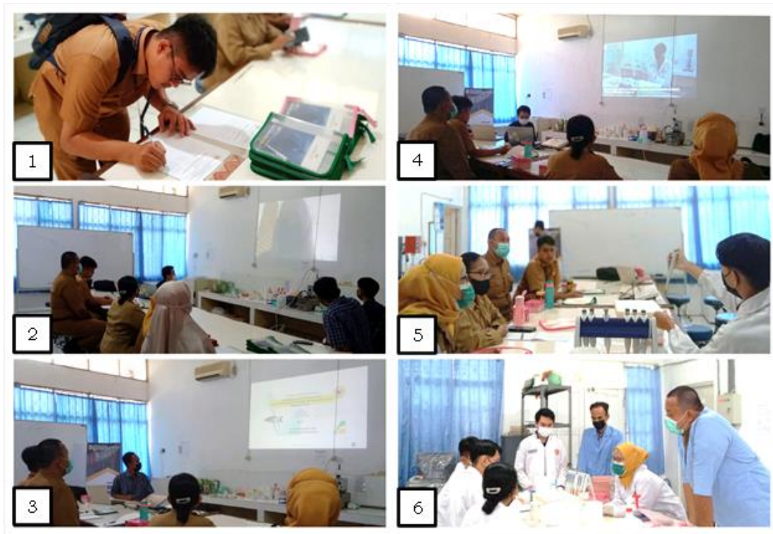
Gambar 2. Pelaksanaan pengabdian. Keterangan: 1 = Registrasi peserta; 2 = Pembukaan ketua pengabdian; 3 = Pemaparan materi; 4 = Pemutaran video tutorial; 5 dan 6 = Penjelasan materi praktik amplifikasi DNA ikan.

secara langsung dengan membagikan kuesioner kepada mitra/peserta pengabdian. Sebanyak 10 orang peserta telah mengisi kuesioner kepuasan mitra pengabdian, yang hasilnya ditampilkan pada Tabel 1.