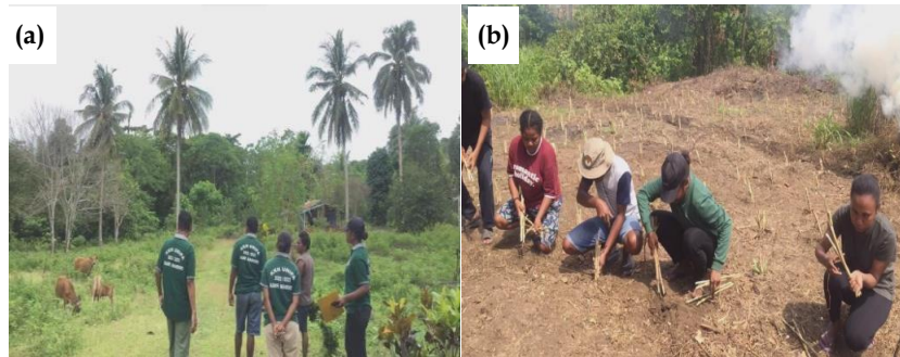
Gambar 8. (a) sensus ternak sapi ; (b) penanaman pakan ternak sapi (rumpun gajah).

Selain bertani, sebagian warga kampung juga beternak ayam, babi dan sapi. Sehingga ada program yang dikerjakan untuk bidang peternakan. Sensus ternak sapi dilakukan bertujuan untuk mendata jumlah hewan sapi di kampung beserta pemiliknya. Mahasiswa KKN juga membantu warga kampung menanam rumput gajah sebagai sumber pakan ternak sapi ( Gambar 8 ). Selanjutnya, mahasiswa turut memperbaiki kandang-kandang ternak ayam dan babi yang sudah rapuh.