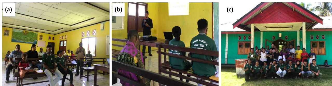
Gambar 11. Presentasi pelaksanaan program kerja oleh peserta KKN ke penduduk kampung (a) sesi tanya jawab ; (b) kata sambutan dan laporan DPL ; (c) foto bersama setelah presentasi.

Selama 36 hari, monev dilakukan oleh DPL sebanyak 3 kali yaitu pada minggu ke-1, minggu ke-3 dan minggu ke-5. Melalui monev, DPL dapat meninjau langsung ke lapangan melihat progress kegiatan sekaligus DPL dapat menanyakan kondisi kesehatan dan mengecek kehadiran mahasiswa. Monev juga bertujuan untuk berdiskusi bersama mahasiswa dan warga kampung, mengevaluasi sejauh mana pelaksanaan kegiatan, mengidentifikasi kendala-kendala serta memberikan usulan-usulan solusi.