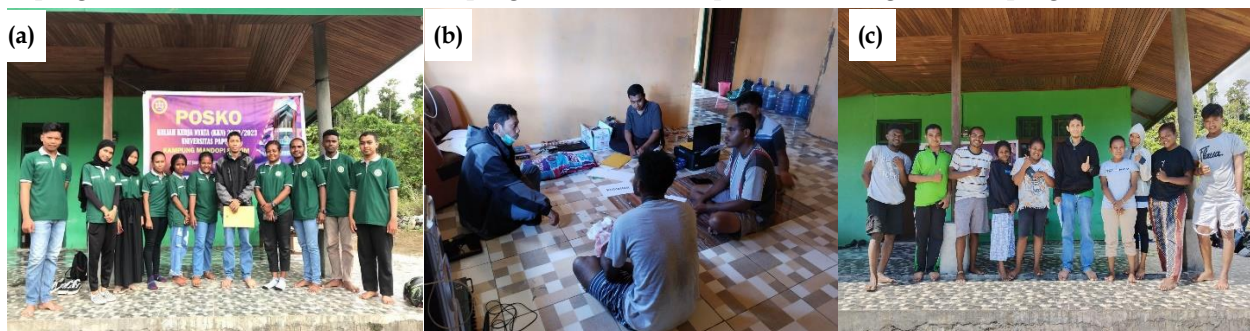
Gambar 10. Monitoring dan evaluasi dari DPL (a) monev 1 ; (b) monev 2 ; (c) monev 3.

Program lainnya terkait dengan bidang ekonomi dan sosial budaya ( Tabel IX dan Gambar 9 ) yang terdiri dari penyuluhan pengolahan pangan lokal dan penyuluhan pemasaran produk. Melalui penyuluhan ini, warga memperoleh pengetahuan dan pengalaman baru dalam memanfaatkan pangan lokal serta cara pemasaran sebagai sumber penghasilan.