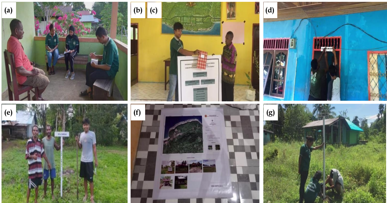
Gambar 2. a) sensus penduduk ; (b) pembuatan buku tamu ; (c) pembuatan struktur organisasi kampung ; (d) papan nama keluarga ; (e) pembuatan papan petunjuk arah aparat desa ; (f) pembuatan peta lokasi dan demografi kampung ; (g) pembuatan papan nama jalan.

Tabel II mencantumkan 7 program kerja dari bidang administrasi kampung yang berhasil dilaksanakan. Adapun seluruh kegiatan pada bidang ini sangat membantu kepala kampung dan jajarannya dalam perihal administrasi. Sensus penduduk dilakukan bertujuan mengumpulkan dan menyajikan data dasar kependudukan dengan detail mencakup jumlah kepala keluarga, jumlah penduduk berdasarkan jenis kelamin (laki-laki dan perempuan), usia, tingkat pendidikan formal, jenis pekerjaan serta alamat rumah. Selanjutnya buku tamu yang baru dibuat untuk merapikan catatan serta merekap data-data kunjungan yang lama. Pembuatan papan nama/arah berguna untuk memberikan petunjuk dan memudahkan warga kampung maupun pengunjung luar jika mendatangi kampung. Dokumentasi dari 7 program kerja tersebut dapat dilihat pada Gambar 2.