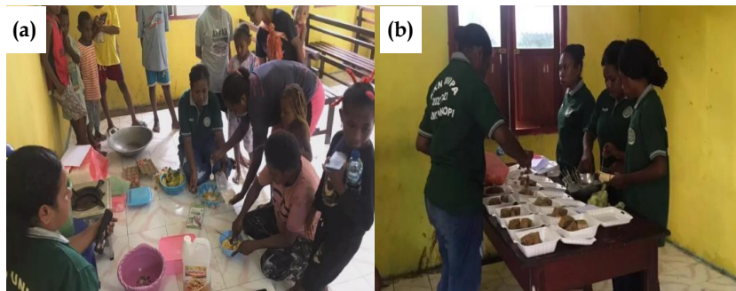
Gambar 9. (a) penyuluhan praktek pengolahan pangan lokal ; (b) penyuluhan pemasaran produk.

Program lainnya terkait dengan bidang ekonomi dan sosial budaya ( Tabel IX dan Gambar 9 ) yang terdiri dari penyuluhan pengolahan pangan lokal dan penyuluhan pemasaran produk. Melalui penyuluhan ini, warga memperoleh pengetahuan dan pengalaman baru dalam memanfaatkan pangan lokal serta cara pemasaran sebagai sumber penghasilan.