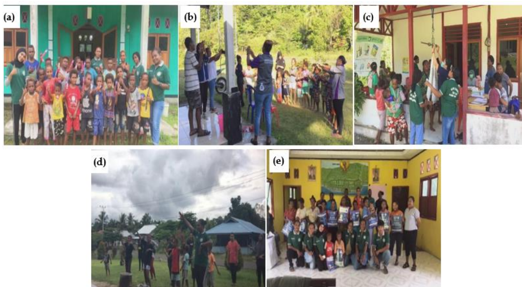
Gambar 4. (a) penyuluhan cara sikat gigi yang benar ; (b) penyuluhan cara mencuci tangan yang benar; (c) membantu pelayanan di posyandu; (d) senam sehat bersama; (e) penyuluhan malaria dan pembagian kelambu kepada masyarakat.