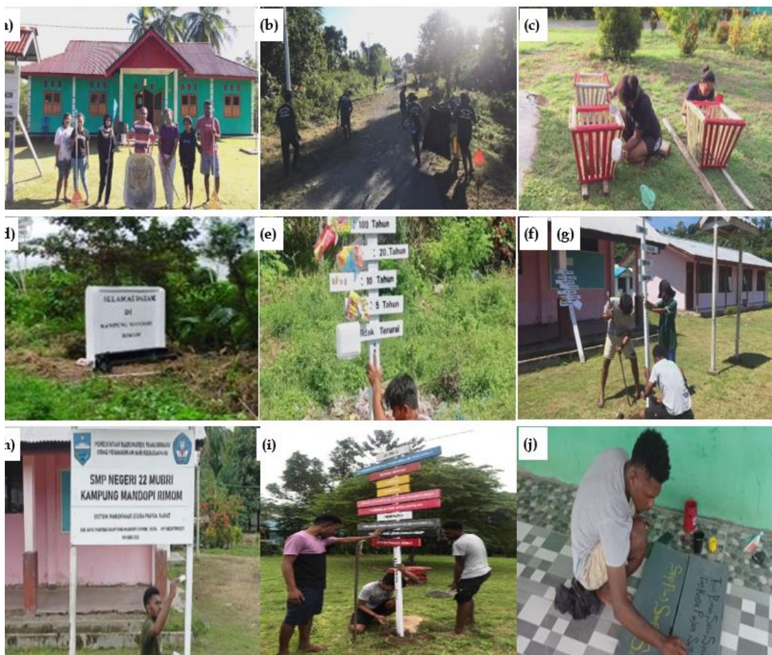
Gambar 5. (a) penghijauan dan penanaman bunga di balai ; (b) jumat bersih ; (c) pembuatan tempat sampah ; (d) pengecatan tugu batas kampung ; (e) pembuatan papan sampah (dalam jangka waktu terurai) ; (f) pembuatan papan 5S di sekolah ; (g) pembuatan papan 7K ; (h) pembuatan papan nama sekolah ; (i) pembuatan papan 10 PKK ; (j) pembuatan papan himbauan (dilarang buang sampah).