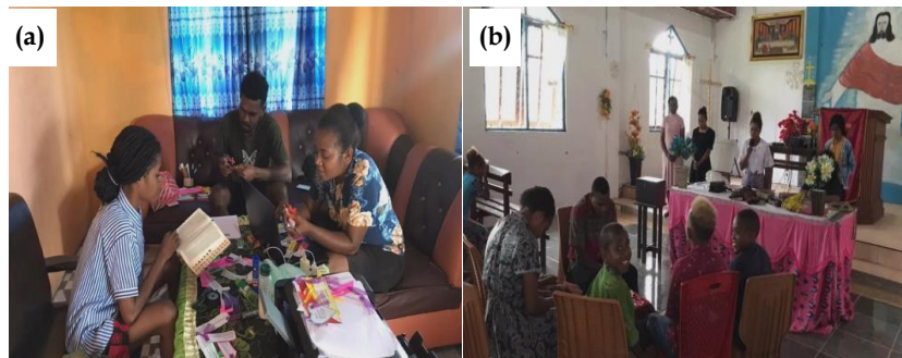
Gambar 6. (a) pembuatan pembatas alkitab ; (b) perlombaan cerdas cermat alkitab.