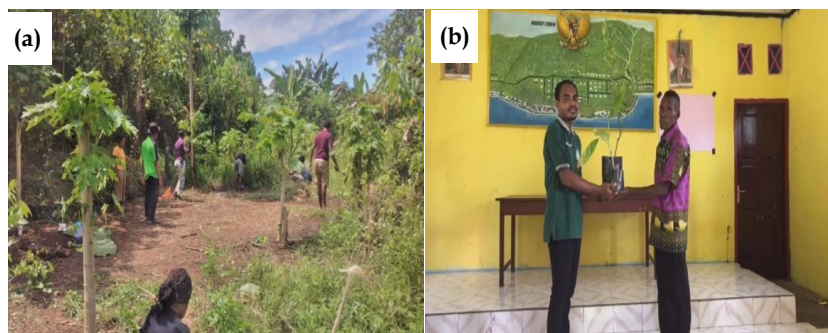
Gambar 7. (a) penanaman bibit ; (b) pemberian tanaman jangka panjang.

Daftar program kerja bidang keagamaan terdiri dari 2 program ( Tabel VI ). Pembatas-pembatas alkitab didesain sendiri oleh mahasiswa KKN dan dibagi-bagikan ke warga saat selesai ibadah di gereja. Berikutnya diadakan perlombaan cerdas cermat alkitab pada hari minggu dengan tujuan menarik minat membaca alkitab khususnya bagi anak-anak dan para remaja. Hadiah-hadiah disiapkan sehingga anak-anak sangat antusias mengikuti lomba. Mahasiswa KKN juga ikut membantu jemaat gereja dalam pelayanan-pelayanan sekolah minggu.