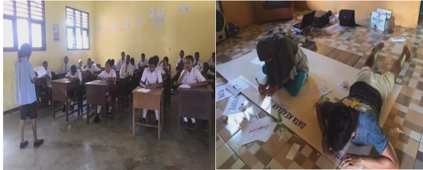
Gambar 3. (a) bimbingan belajar membaca dan berhitung ; (b) membantu administrasi sekolah ; (c) melaksanakan kegiatan PLS SMP 22 Mubri ; (d) mengajar di SD dan SMP Mubri ; (e) Pembuatan papan data siswa/i dan guru.

Tabel IV memuat 5 program kerja bidang pendidikan dan dokumentasi kegiatannya seperti yang ditunjukkan pada Gambar 3. Bimbingan belajar dilakukan diluar jam sekolah dengan sasaran siswa-siswa SD dan SMP. Fokus bimbingan adalah terhadap kemampuan literasi dan numerikal siswa, dimana alat-alat tulis serta buku-buku bacaan disiapkan oleh mahasiswa. Kegiatan bimbingan ini diadakan sekali dalam seminggu dengan durasi 120 menit. Di kesempatan lain, mahasiswa KKN bekerjasama dengan pihak sekolah setempat untuk membantu guru-guru dalam melaksanakan pembelajaran dalam kelas. Jenis mata pelajaran yang diampuh disesuaikan dengan latar belakang pendidikan mahasiswa. Mahasiswa KKN juga ikut berpartisipasi dalam kegiatan Pengenalan Lingkungan Sekolah (PLS) di SMP Negeri 22 Mubri dengan memberikan materi terkait lingkungan dan tata tertib sekolah kepada siswa/i baru. Aktivitas-aktivitas ini sebagai cara bagaimana mahasiswa belajar mentransformasikan ilmu pengetahuan yang diperoleh dari ruang kuliah ke masyarakat.