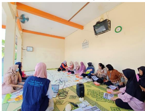
Gambar 1. Kegiatan edukasi dan praktik langsung dengan ibu hamil.