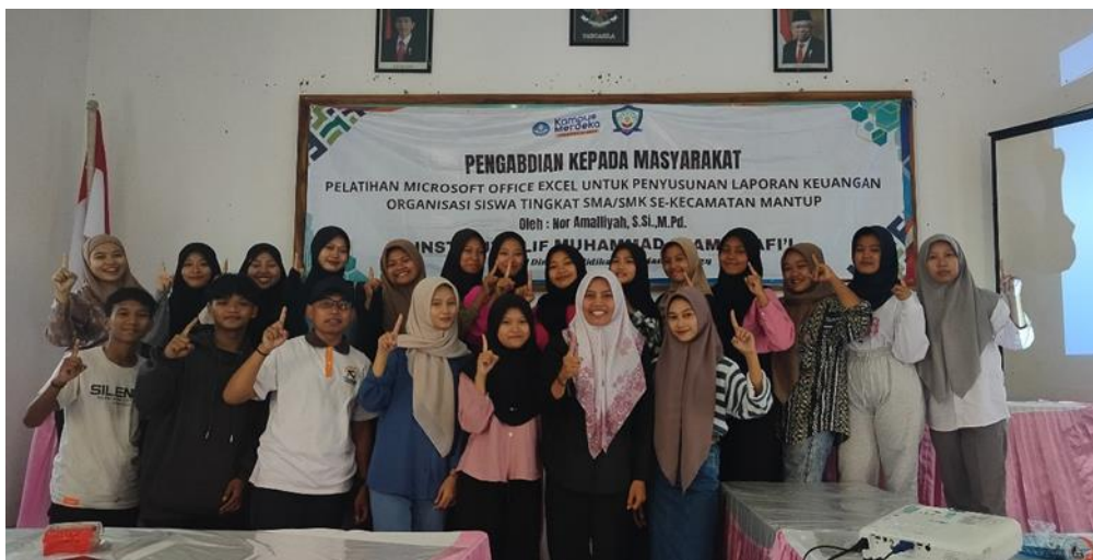
Gambar 2. Dokumentasi Kegiatan.

Hasil kegiatan pelatihan ini adalah menambah pengetahuan serta meningkatkan keterampilan siswa dalam penyusunan laporan keuangan menggunakan aplikasi Microsoft Office Excel . Kegiatan pelatihan terlaksana dengan lancar sesuai jadwal yang telah disusun. Peserta pelatihan terlihat antusias dalam menyimak materi yang dipaparkan. Setelah pemaparan materi muncul beberapa pertanyaan terkait operasi dasar yang telah dijelaskan, misalkan bagaimana cara menjumlahkan/mengurangi pada sheet yang berbeda dan menjumlahkan semua data yang ada dengan fungsi = SUM(Range) .