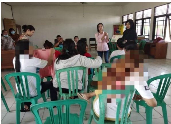
Gambar 1. Kategori berdasarkan tingkat pengetahuan responden tentang infeksi menular seksual setelah diberikan penyuluhan kesehatan di Lokalisasi Km. 12 Kota Palangka Raya

sebelum diberikan penyuluhan kesehatan tentang infeksi menular seksual di Lokalisasi Km. 12 Kota Palangka Raya dapat dilihat pada Gambar 2. Berdasarkan data diketahui bahwa dari 25 responden, 16 orang (64%) memiliki tingkat pengetahuan cukup, 8 orang (32%) memiliki tingkat pengetahuan kurang dan 1 orang (4%) memiliki tingkat pengetahuan baik. Dominan berdasarkan tingkat pengetahuan sebelum diberikan penyuluhan kesehatan yaitu cukup.