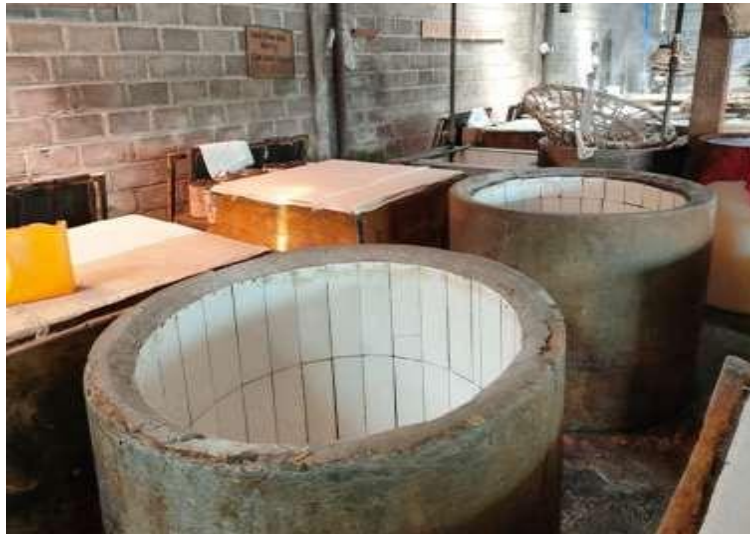
Gambar 2. Lokasi pembuatan tahu putih di Desa Karangayar, Kecamatan Wates, Kabupaten Kediri.