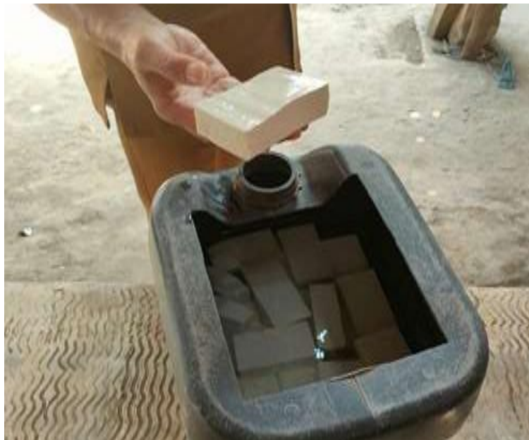
Gambar 3. Jenis tahu putih yang diproduksi oleh perajin tahu di Desa Karangayar, Kecamatan Wates, Kabupaten Kediri.