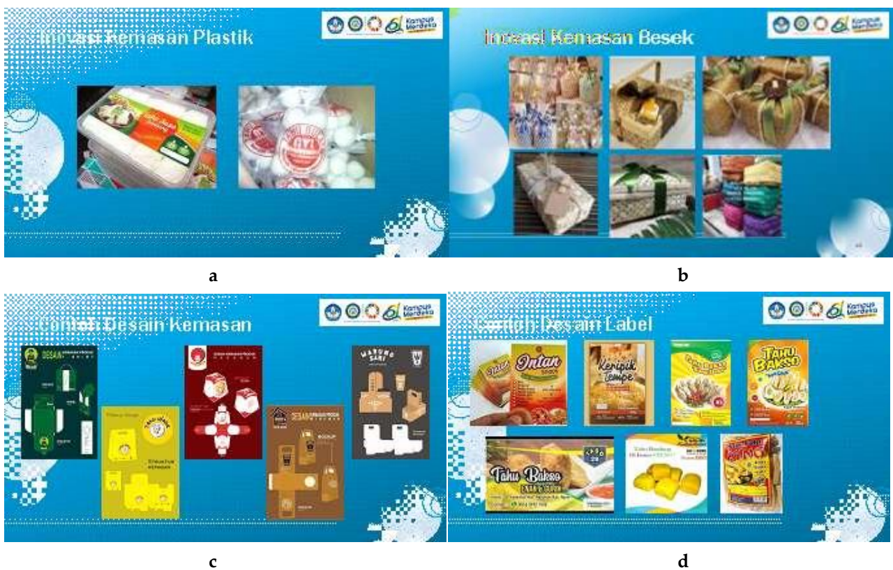
Gambar 6. Contoh kemasan modern (a); konvensional (b); contoh inovasi desain (c); dan label (d) yang dapat digunakan dalam memasarkan produk olahan tahu.