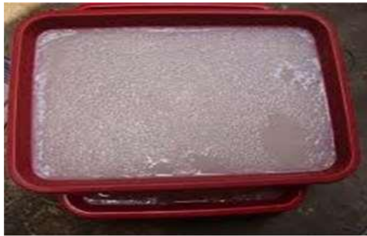
Gambar 5. Inovasi limbah cair tahu menjadi pangan sehat nata de whey.