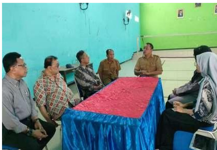
Gambar 1. Pertemuan pertama dengan perangkat Desa Karanganyar, Kecamatan Wates, Kabupaten Kediri.

Kegiatan pengabdian masyarakat ini diikuti oleh 28 dari 50 perajin tahu yang diundang beserta keluarga mereka. Jumlah peserta yang lebih sedikit dari perencanaan disebabkan oleh kesibukan sebagian perajin dalam memproduksi tahu. Meskipun jumlah peserta yang hadir lebih rendah dari target, antusiasme peserta yang mengikuti kegiatan menunjukkan adanya kebutuhan akan pelatihan dan pengembangan kapasitas bagi perajin tahu di daerah ini. Rendahnya jumlah peserta yang hadir menjadi kendala dalam pelaksanaan kegiatan. Hal ini mengindikasikan pentingnya fleksibilitas dalam penjadwalan kegiatan pengabdian masyarakat di masa mendatang untuk mengakomodasi kesibukan para perajin. Dokumentasi pelaksanaan kegiatan dapat dilihat pada Gambar 1 sampai 7.