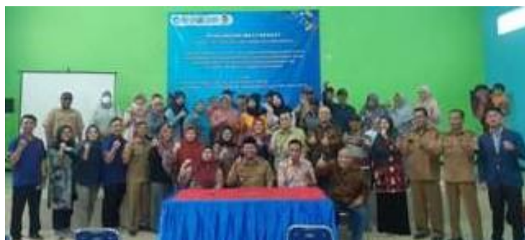
Gambar 7. Foto bersama antara pemateri, peserta dan Kepala Desa Karanganyar sebagai mitra kegiatan pengabdian masyarakat.