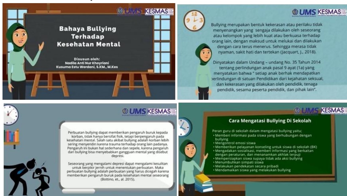
Gambar 1. Isi Media Video.

Kegiatan pengabdian dilakukan pada pukul 09.00 dengan menggunakan metode pemberian media video. Jumlah siswa yang menjadi responden sebanyak 45 orang berdasarkan karakteristik yang tertera pada Tabel 1. Responden laki-laki tercatat sebanyak 64% sementara perempuan sebanyak 36%, dengan rentang usia antara 12 – 16 tahun, dan usia paling banyak adalah usia 13 tahun sebanyak 47%.