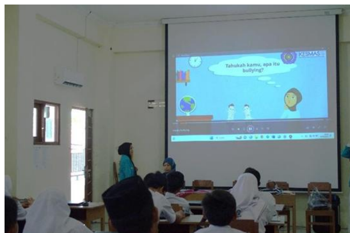
Gambar 3. Pemberian Media Video oleh Peneliti.