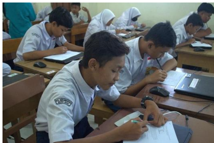
Gambar 2. Kegiatan Mengerjakan Soal Pre-test dan Post-test .

kecemasan atau gangguan depresi. Dampak kesehatan mental pada pelaku seperti gangguan emosi, risiko pecandu alkohol, obat-obatan terlarang serta menjadi pelaku kekerasan. Dampak kesehatan mental pada korban adalah gangguan cemas, trauma, melukai diri sendiri, insomnia, menurunnya prestasi dan kurangnya fokus dalam konsentrasi belajar, sulit percaya orang sekitar, serta bunuh diri (Wolke et al. , 2015). Guru berperan penting dalam mengatasi, menindak lanjuti Bullying yang terjadi di sekolah sehingga dapat membangun karakter yang baik agar anak berkembang dengan baik (Ayu et al. , 2024). Salah satu upaya untuk menekan angka kejadian Bullying dengan memberikan informasi kepada target yang tepat. Pemberian edukasi di sekolah melalui penggunaan video literasi sebagai media pembelajaran yang dipilih dengan visual dan audio. Media video dipercaya mudah dipahami oleh siswa sebagai suatu media pembelajaran yang efektif dan menyenangkan (Afriza, 2022). Dengan demikian, penting untuk dilakukannya pencegahan Bullying dengan memberikan intervensi dini dan efektivitas untuk mengurangi dampak negatif dari Bullying di sekolah terhadap kesehatan siswa (Celdrán-Navarro et al. , 2024).