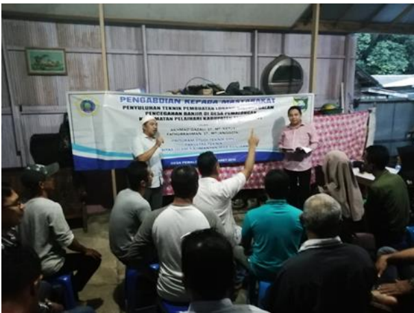
Gambar 3. Kegiatan Penyuluhan Bersama Warga Desa Pemalongan

Berdasarkan kebutuhan lapangan dalam rangka mendukung program pemerintah dalam mengatasi kesediaan air dan penyelamatan lingkungan ini, maka tim pengabdian pada masyarakat Universitas Islam Kalimantan Muhammad Arsyad Al Banjari Banjarmasin melakukan kegiatan penyuluhan dan praktek pembuatan lubang biopori di wilayah Kabupaten Tanah Laut, terutama Kecamatan Pelaihari. Hal ini dilakukan sebagai upaya untuk menyadarkan masyarakat terhadap pentingnya biopori dalam mengatasi kelebihan sampah dan kekurangan ketersediaan air. Dokumentasi kegiatan pengabdian dapat dilihat pada Gambar 3 berikut ini.