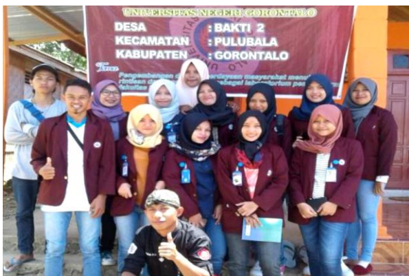
Gambar 2. Peserta KKS di Desa Bakti, Kec.Pulubala

Selanjutnya dilakukan pembekalan di Aula FIP UNG, materi: 1) hakekat KKS; 2) soft skill (kepemimpinan, teknik komunikasi yang efektif); 3) wawasan