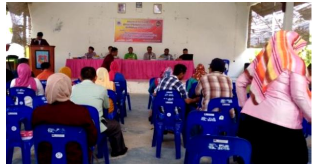
Gambar 4. Pelatihan Manajemen Keuangan Desa

meningkatkan kinerja pemerintah desa Bakti menuju desa cerdas, seperti Gambar 4 .