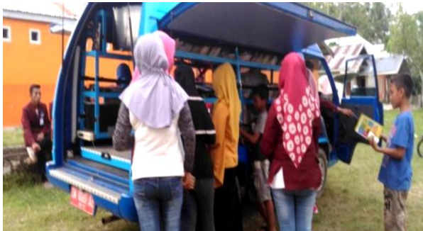
Gambar 3. Siswa SD di Desa Bakti Kec. Pulubala Kab. Gorontalo antusias membaca buku

Layanan taman bacaan diberikan mahasiswa KKS dengan kehadiran mobil pintar milik FIP UNG selama KKS di 2 PAUD, 2 TK, 5 SD dan 4 SMP yang ada di Desa Bakti. Pengoperasian mobil pintar diapresiasi warga Desa Bakti meningkatkan minat membaca warga, kehadiran siswa ke sekolah meningkat. Mobil pintar difasilitasi alat peraga dongeng, krayon, alas untuk membaca, menulis, bahkan nonton film yang menarik anak-anak untuk mengunjungi mobil pintar yang dioperasikan pada saat jam istirahat di sekolah secara bergantian pada sekolah sasaran. Selain itu warga dan sekolah yang aktif diberi sertifikat dalam kegiatan tersebut, seperti terlihat pada Gambar 3 .