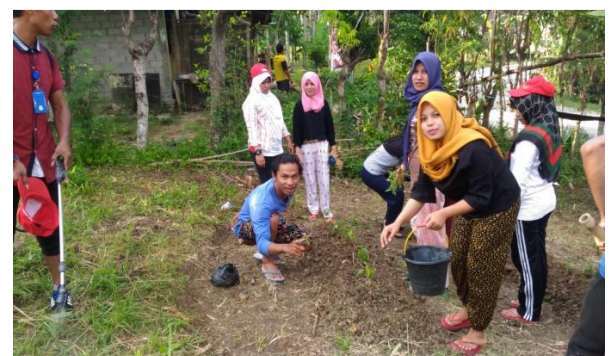
Gambar 5. Mahasiswa menanam bibit pertanian

Program ini direalisasikan melalui pembuatan kebun berisi tanaman produktif seperti Bawang, rica, tomat, dan Tanaman Obat Keluarga (TOGA). Tanaman ini menjadi pengobatan alternatif murah dan bermanfaat bagi seluruh masyarakat. Tanaman obat ini dilaksanakan di pekarangan warga desa Bakti sebagai kebun percontohan yang dikembangkan bersama ibu-ibu PKK desa Bakti. Dalam program ini didiadakan bibit yang diperoleh dari bantuan Balai Pengelolaan DAS dan Hutan Lindung Kab. Bone Bolango berjumlah 3.000 batang pohon. Proses pembuatan kebun ini berlangsung dua minggu dari proses pembersihan, membuat bendengan hingga penanaman bibit dan pohon pelindung. Bibit yang diberikan terbagi atas lima jenis yaitu, Jambu Bangkok, Trambesi, Pucuk Merah, Pinang, Nandu dan Mahoni yang ditanam ditempat strategis seperti Gambar 5 .