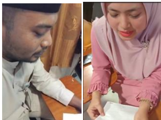
Gambar 3. Peserta Mengikuti Tes Awal.