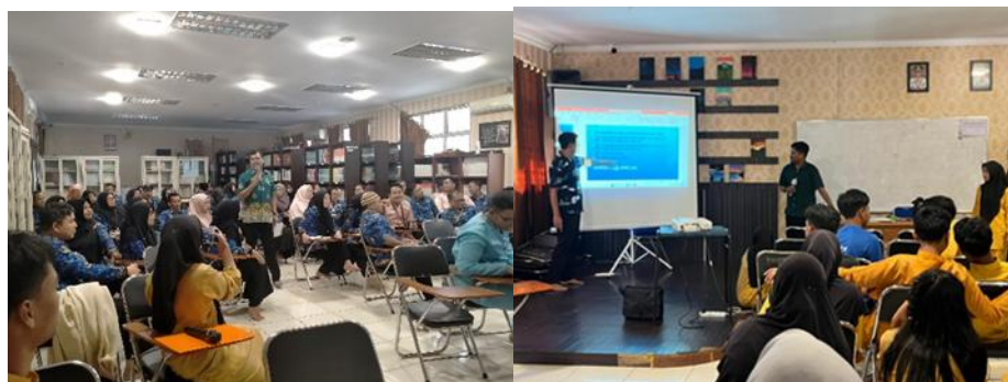
Gambar 4. Kegiatan Pelatihan.

Pada pertemuan kedua, tim pengabdian dan peserta berdiskusi tentang sub materi assimilation , elision , dan silent letters . Karena materi lebih banyak dari pelatihan sebelumnya, maka pelatihan selama dua jam hanya disuguhkan tiga sub materi. Agar peserta tidak merasa bosan, setiap selesai satu sub materi, tim pengabdian memberikan kuis berupa pelafalan kata dan kalimat berbahasa Inggris sesuai pembahasan.