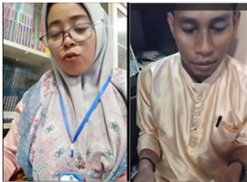
Gambar 5. Peserta Mengikuti Tes Akhir.

Pertemuan ketiga adalah pertemuan terakhir. Tim pengabdian dan peserta mendiskusikan tentang sub materi terakhir yaitu intrusive [j] dan [w]. Intrusive [j] dan [w] adalah menambahkan bunyi [j] atau [w] di antara bunyi vokal. Peserta diberikan contoh kata dalam bahasa Indonesia yaitu biasa [bi-j-asa:] dan duit [du-w-it]. Dua kata tersebut disisipi dengan bunyi [j] dan [w] di antara bunyi vokal. Peserta diberikan beberapa contoh kata seperti so I come [səʊ-w-aɪ kʌm], may I come? [meɪ-j-aɪ kʌm], dan lainnya. Setelah selesai, tim pengabdian memberi kesimpulan tentang materi yang sudah didiskusikan. Peserta diberi kuis pelafalan sesuai materi dengan contoh kata dan kalimat bahasa Inggris. Dalam hal ini, agar peserta bersemangat, peserta yang mampu melafalkan dengan sesuai maka diberi hadiah berupa coklat. Kegiatan dilanjutkan dengan pemberian tes akhir kepada peserta yaitu pelafalan kalimat yang sama dengan kalimat pada tes awal. Pelatihan ditutup dengan pemberian masukan dari peserta dan pihak sekolah SMA Negeri 16 Batam yang diwakili oleh kepala sekolah.