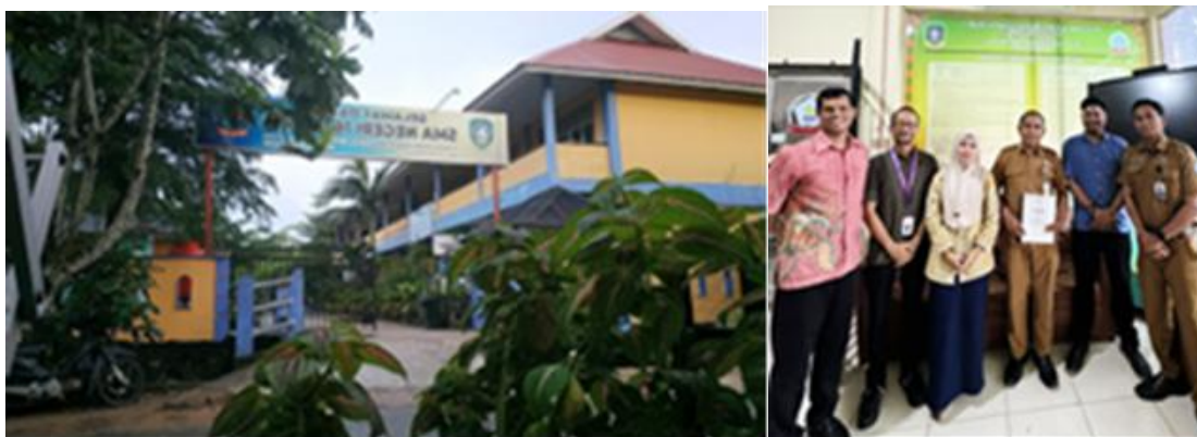
Gambar 1. Kunjungan Tim Pengabdian ke SMAN 16 Batam.

percakapan sehari-hari, tidak diwajibkan berbahasa Inggris, bahasa Inggris bukan bahasa pengantar dalam proses belajar mengajar, dan tidak ada pelatihan bahasa Inggris. Dan menurut guru-guru, menguasai bahasa Inggris dapat memperkaya pengetahuan sehingga pelatihan bahasa Inggris untuk guru-guru penting dilakukan.