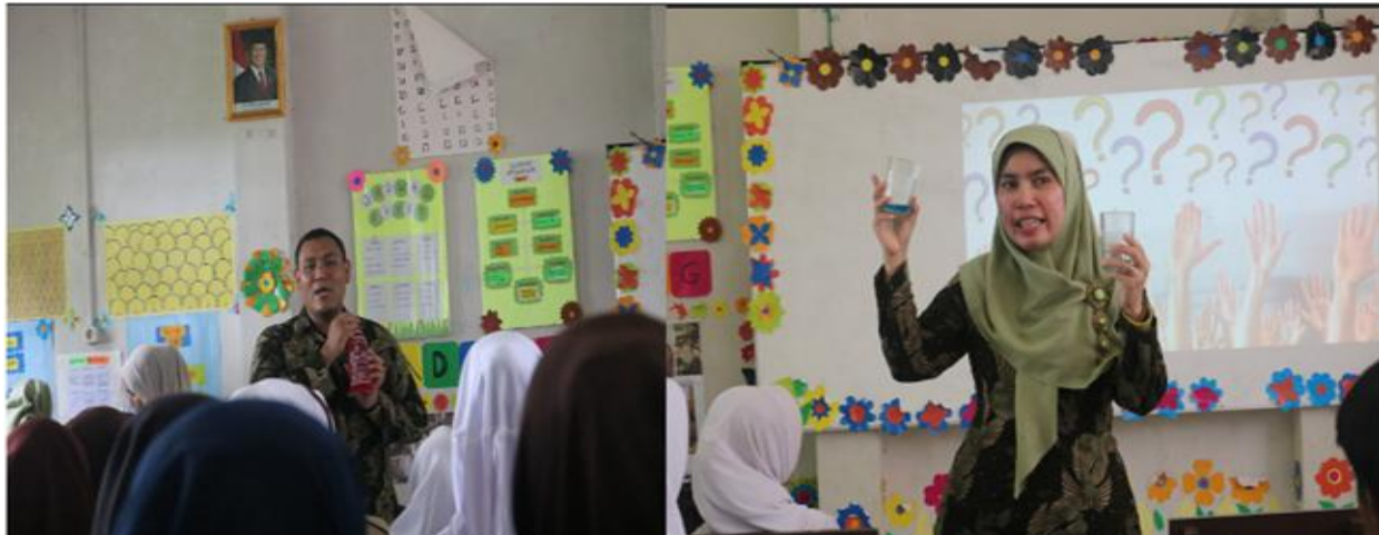
Gambar 1. Pemaparan materi oleh pengabdian.

Sebagai tahap evaluasi, tim pengabdian memberikan post-test setelah seluruh rangkaian penyuluhan selesai. Soal post-test diberikan secara tertulis dengan tujuan untuk menilai efektivitas materi yang telah disampaikan. Hasil evaluasi menunjukkan peningkatan signifikan dalam pemahaman siswa, dengan nilai post-test mencapai 74,4%. Peningkatan sebesar 21,1% ini menjadi indikasi bahwa materi yang diberikan telah berhasil meningkatkan kesadaran dan pemahaman siswa mengenai bahaya pewarna makanan sintetis serta pentingnya memilih bahan pangan yang lebih sehat.