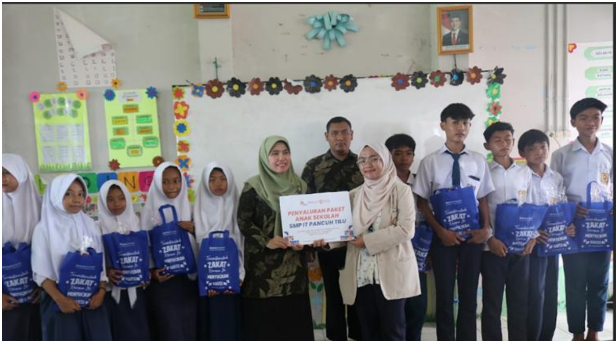
Gambar 4. Penyerahan souvenir dari LAZNAS Bakrie Amanah.