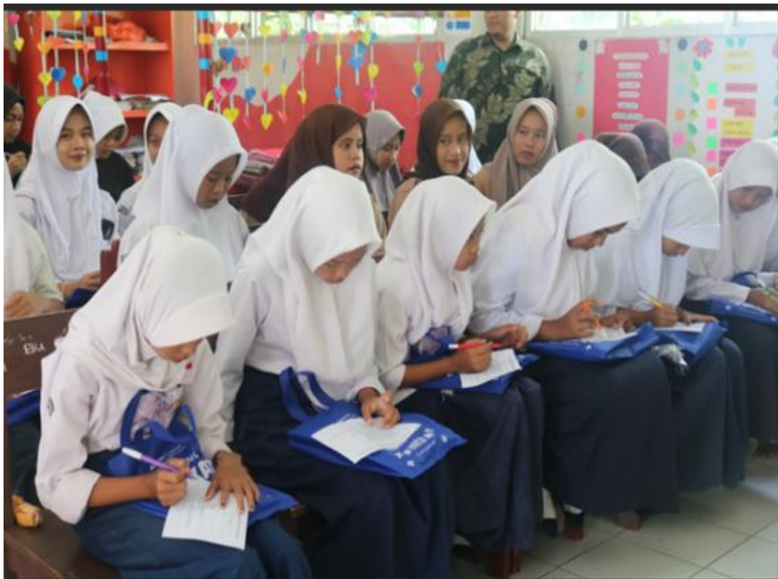
Gambar 1. Sesi Pre/Post-test selama PKM.

Kegiatan pengabdian ini diawali dengan pemberian pre-test kepada siswa-siswi SMP IT Pancuh Tilu, Desa Jayagiri, Kecamatan Sindang Barang, Kabupaten Cianjur. Pre-test diberikan secara tertulis untuk mengukur tingkat pemahaman awal mereka mengenai pewarna makanan sintetis serta dampaknya terhadap kesehatan. Berdasarkan hasil pre-test , diperoleh data bahwa tingkat pemahaman siswa berada pada angka 54,3%. Hasil ini kemudian dijadikan acuan dalam penyusunan strategi penyampaian materi, sehingga aspek-aspek yang masih kurang dipahami dapat lebih ditekankan oleh narasumber.