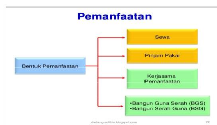
Gambar 2. Bentuk Pemanfaatan BMD

asli daerah (PAD) serta meningkatkan fasilitas publik. Konsep pemanfaatan Barang Milik Daerah dalam peningkatan pendapatan asli daerah, metode pemanfaatan Barang Milik Daerah, penetapan kontribusi, metode pemanfaatan Barang Milik Daerah yaitu sewa, pinjam pakai, kerja sama pemanfaatan, bangun guna serah, bangun serah guna, dan kerja sama infrastruktur yang satu sama lain memiliki tujuan, keunggulan dan karakteristik tersendiri. Dalam rangka peningkatan pendapatan asli daerah, setiap metode pemanfaatan Barang Milik Daerah (kecuali pinjam pakai) memiliki bentuk kontribusinya masing-masing yang mampu meningkatkan pendapatan daerah dan/atau peningkatan aset daerah. Pemilihan metode pemanfaatan aset hendaknya didasarkan pada visi dan misi daerah serta metode yang paling memberikan dampak rentetan terbesar terhadap pertumbuhan ekonomi daerah (M.Yusuf, 2015)